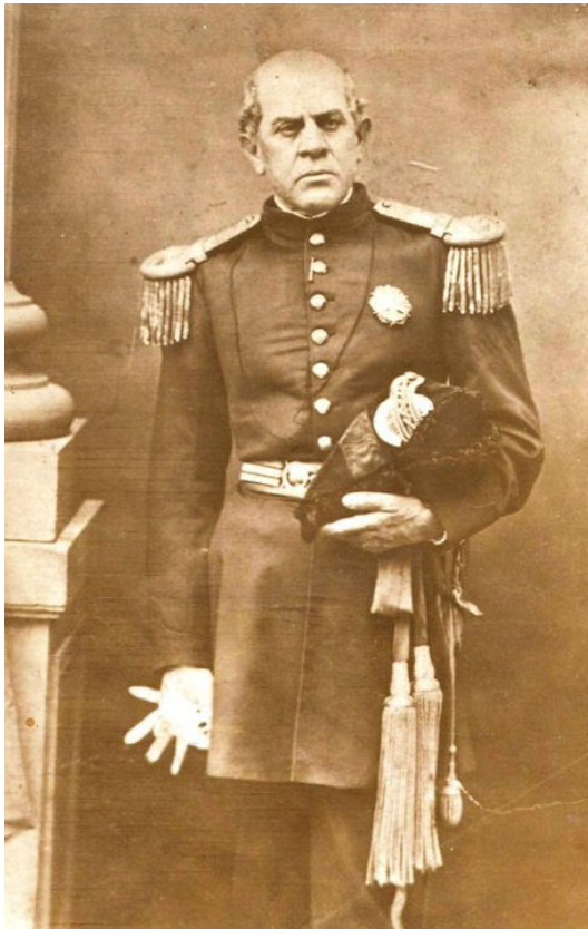
Domingo Faustino Sarmiento, futur président de l'Argentine, visite l'exposition universelle de Paris en 1867. Archives Nationales d'Argentine, domaine public.

Ceci est la version auteur de l'article: Pascal Griset, Léonard Laborie, « L'émigration lotoise et le développement de la viticulture argentine au 19e siècle », Bulletin de la Société des Etudes du Lot , t. 143, 2022/4, p. 340-345.