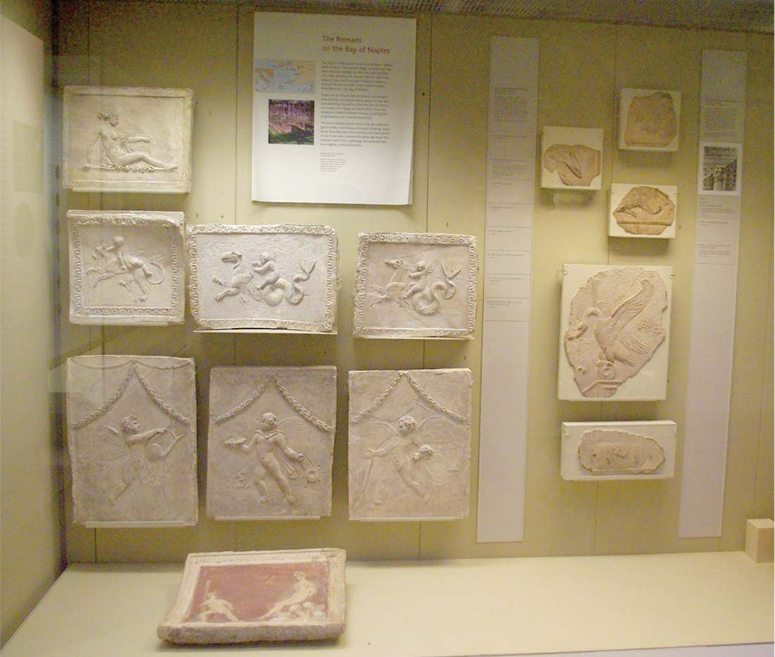
Figure 2 - Stucs de Pozzuoli provenant de la collection Hamilton exposés dans une vitrine du British Museum (pièce 70)

mauvais état de conservation et qui, de plus, a longtemps été occulté par les études de décors plus spectaculaires, de peintures murales ou de mosaïques romaines.