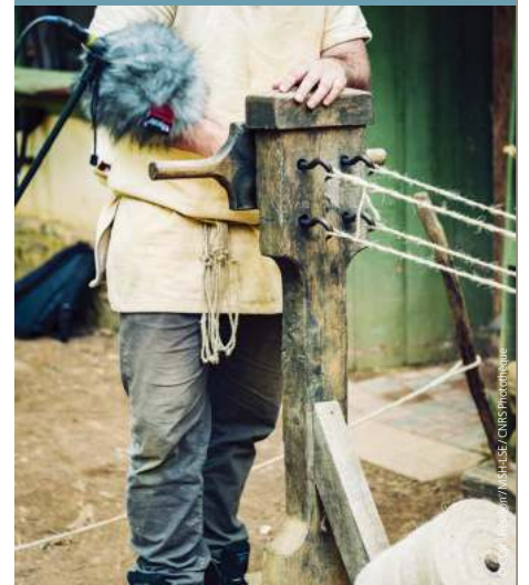
Captation sonore du tissage d'une corde, château de Guédelon, Yonne