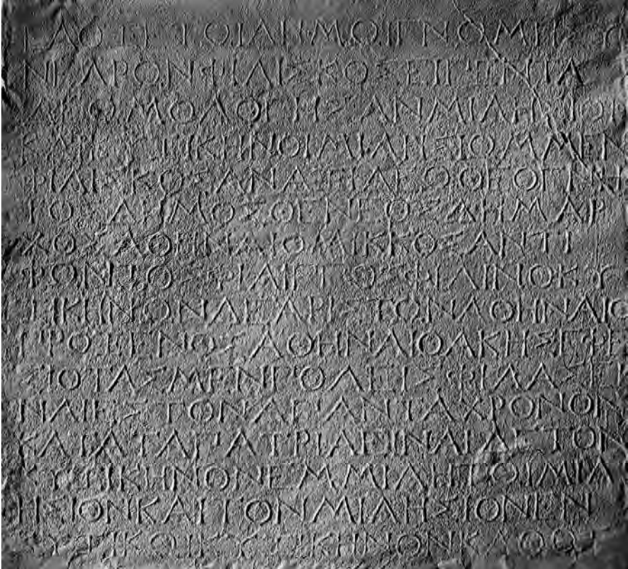
Fig. 5. Convention Milet-Cyzique. Milet I.3, 137; photographie de l'estampage (Berlin, BBAW).