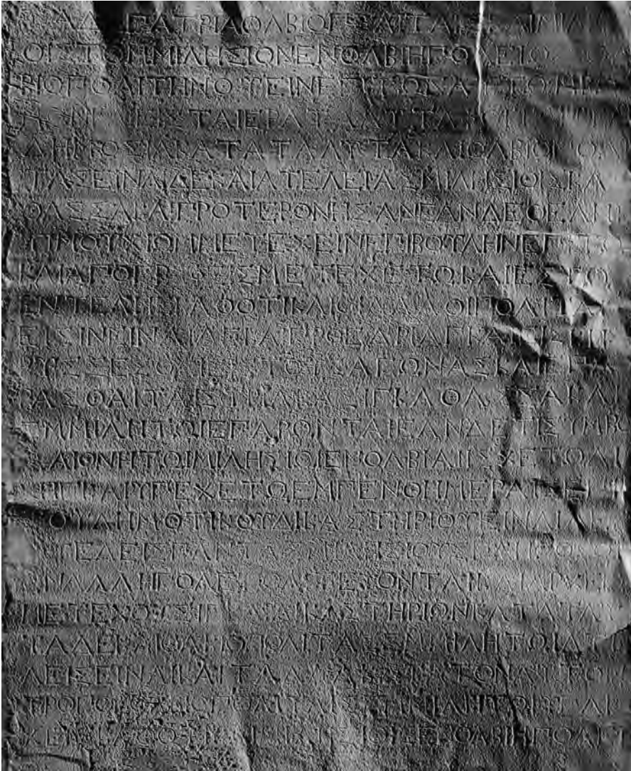
Fig. 1. Convention Milet-Olbia. Milet I.3, 136; photographie de l'estampage (Berlin, BBAW).

de très nets apices , que l'on voit bien sur les oméga par exemple (Fig. 2); d'autre part, les lettres ont tendance à s'arrondir, comme le upsilon (Fig. 3). Une telle graphie suggère une datation au III e s. av. J.-C., peut-être dans la première moitié, même si rien n'est certain. La comparaison avec le décret pour Kios par exemple, daté de 228 par Rehm, ne montre pas de différence notable