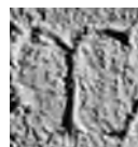
Fig. 3. Milet I.3, 136, détail du upsilon.