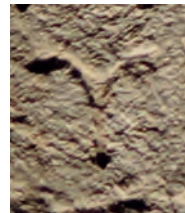
Fig. 7. Milet I.3, 137, détail du upsilon .