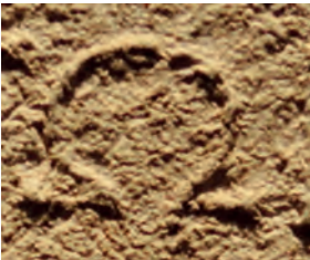
Fig. 6. Milet I.3, 137, détail du oméga .