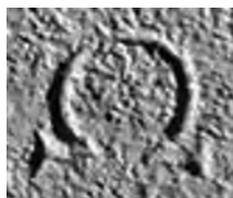
Fig. 2. Milet I.3, 136, détail du oméga.