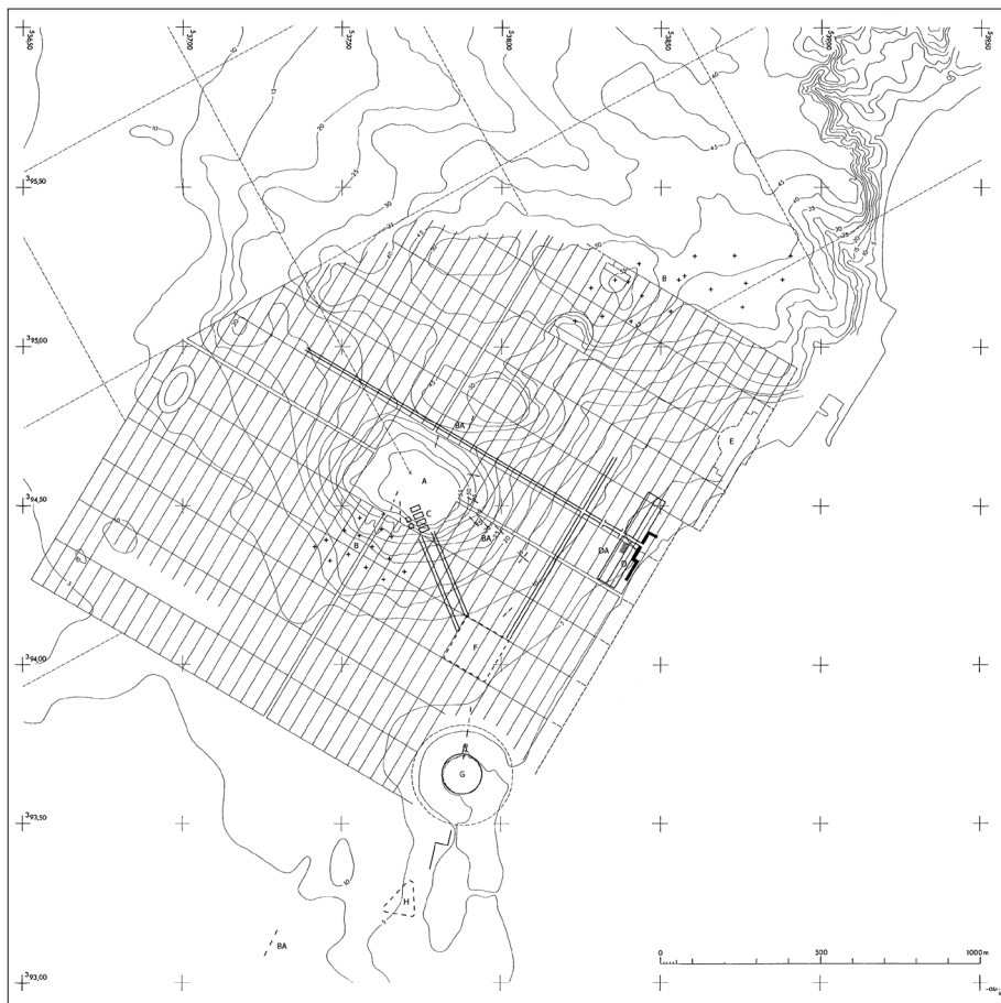
Fig. 2 - Plan schématique de la ville romaine de Carthage à la fin du II e siècle apr. J.-C. d'après Ch. Saumagne (corrigé). Échelle 1:12 500. En tracé épais : tentative de reconstruction du plan de développement punique (fin du V e – II e siècle av. J.-C.). A. Byrsa ; B. Nécropoles tardo-puniques ; BA. Alignements puniques ; C. Fouille française ; D. Fouille allemande ; DA. Céramique archaïque ; E. Thermes d'Antonin ; F. Agora punique (?) ; G. Port de guerre punique ; H. Tophet. DAO N. Coquet ; dessin G. Stanzl avec la collaboration de S. Lancel et G. Robine (d'après 150-JAHR-FEIER 1982).

Phileros, fut en particulier chargé de procéder sur le terrain à des opérations techniques qui consistent notamment à diviser le territoire entre des colons carthaginois relevant des différents pagi et des pérégrins regroupés dans des localités, au nombre de 83, appelées castella 141 . Il en résulta le développement de nombreuses agglomérations secondaires, au moins 83, dans lesquelles des citoyens de Carthage cohabitaient avec des membres d'une communauté pérégrine et dont l'exemple le mieux connu est celui de Thugga 142 .