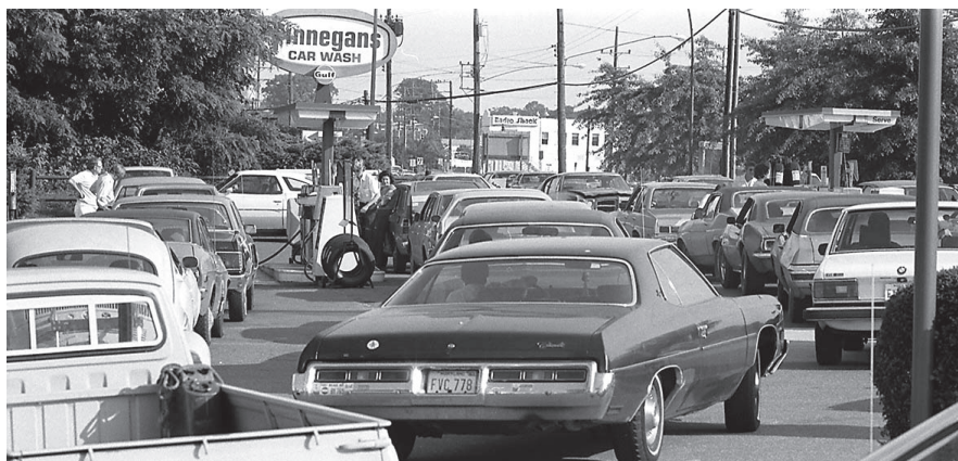
File d'attente à une station service dans l'État de Maryland (États-Unis), juin 1979

n'en ai pas trouvé trace dans les archives de la tour Total actuelle, où l'on trouve les archives de Total et d'Elf. Total et Elf ont-elles reçu les études commanditées à l'université de Stanford en 1968 et 1969 par l'API ? Je ne le sais pas. Il y a certainement également un autre canal de diffusion internationale qui est le Concave, qui regroupe depuis 1963 les sociétés européennes de raffinage dans la défense de leurs intérêts en matière de normes et de pollution. Cela a-t-il été aussi une arène de circulation de savoir au sein de la profession pétrolière ? Je n'ai pas pu encore le vérifier. Toujours est-il qu'un indicateur net de la présence du réchauffement climatique dans les radars intentionnels des dirigeants pétroliers français au plus haut niveau est la brochure Industrie pétrolière et environnement qui est publiée en 1971 par le Syndicat patronal des industries pétrolières. Celle-ci contient une page sur le réchauffement global, en évoquant un lent accroissement de la teneur moyenne en CO 2 de l'atmosphère, tout en disant que ce n'est pas si grave que cela et que l'on