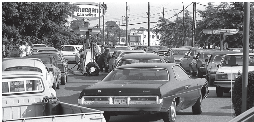
File d'attente à une station service dans l'État de Maryland (États-Unis), juin 1979

n'en ai pas trouvé trace dans les archives de la tour Total actuelle, où l'on trouve les archives de Total et d'Elf. Total et Elf ont-elles reçu les études commanditées à l'université de Stanford en 1968 et 1969 par l'API ? Je ne le sais pas. Il y a certainement également un autre canal de diffusion internationale qui est le Concave, qui regroupe depuis 1963 les sociétés européennes de raffinage dans la défense de leurs intérêts en matière de normes et de pollution. Cela a-t-il été aussi une arène de circulation de savoir au sein de la profession pétrolière ? Je n'ai pas pu encore le vérifier. Toujours est-il qu'un indicateur net de la présence du réchauffement climatique dans les radars intentionnels des dirigeants pétroliers français au plus haut niveau est la brochure Industrie pétrolière et environnement qui est publiée en 1971 par le Syndicat patronal des industries pétrolières. Celle-ci contient une page sur le réchauffement global, en évoquant un lent accroissement de la teneur moyenne en CO 2 de l'atmosphère, tout en disant que ce n'est pas si grave que cela et que l'on