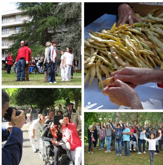
Figure 5 Le corps médiateur pour une relation à soi, à l'autre et à son environnement.

Sur le chemin de découvertes multiples, en relation avec les thématiques des balades (les diverses reconnections évoquées), les participants peuvent également se réapproprier une variété de rythmes, faire l'expérience d'autres temporalités : une programmation qui se dévoile peu à peu, au fur et à mesure de la journée ou de deux jours; la saisonnalité de la nature; les temps de la vie jusqu'au vieillissement; les ruptures de rythme au fil de la balade (y compris des temps de sieste); bref, le temps des autres pour se signifier à soi-même que la ville est multitemporelle et que prendre en compte ces chronotopies est essentiel pour qui aspire à une ville habitable pour tous, à échelle humaine (Gwiazdzinski, 2016) 15 .