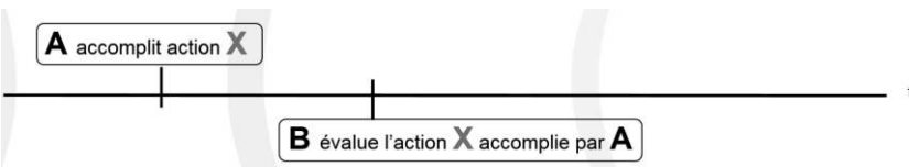
Figure 2 : Évaluer