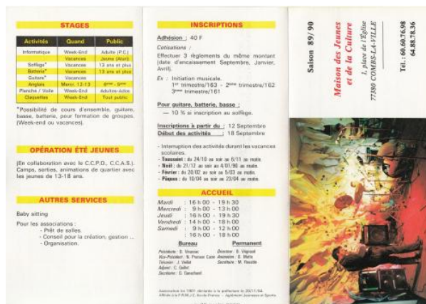
Archives du Val-de-Marne, 501J 355, Fédération régionale des maisons des jeunes et de la culture d'Île-de-France, programme d'activités de la MJC de Combs-la-Ville (Seine-et-Marne), 1989.

Issue, en France, de l'éducation populaire, l'animation socio-culturelle vise depuis les années 1960 à favoriser la vie sociale et culturelle à l'échelle d'un équipement, d'une commune ou d'un projet. Elle entretient une forte proximité avec les secteurs professionnels de l'éducation, de la culture, du social, mais aussi de la formation, du sport, de l'insertion, du tourisme ou encore du médico-social. En dépit de cette proximité, sa légitimité professionnelle est loin d'être acquise alors même que l'on définit souvent ses activités comme importantes, voire essentielles, à la cohésion sociale.