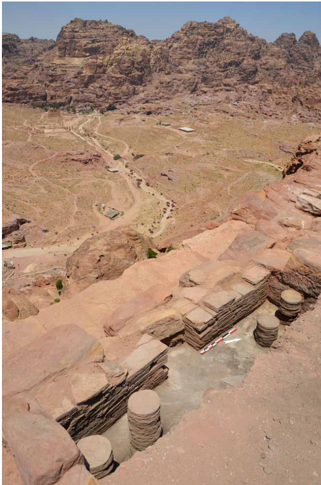
Fig. 4 : Hypocaustes du caldarium des bains de la Khubthah en cours de fouille. Au second plan le centre-ville antique (MAFP 2015)