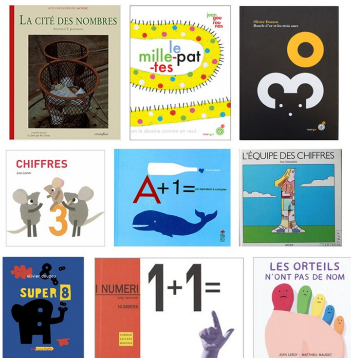
fig. 1 : De gauche à droite et de haut en bas : Johnson, S.-T. (1998). La cité des nombres . © Circonflexe - Gourounas, J. (2012). Le mille-pattes . © Le Rouergue - Douzou, O. (2011). Boucle d'or et les trois ours . © Le Rouergue - Lionni, L. (1985). Chiffres . © L'école des loisirs - Gibert, B. (2017). A+1= . © Saltimbanque éditions - Alessandrini, J. (1987). L'équipe des chiffres . © Hatier - Douzou, O. (2005). Super 8 . © MeMo - Veronesi, L. (1997). I numeri . © Corraini editore mantova - Leroy, J. et Maudet, M. (2010). Les orteils n'ont pas de nom . © L'école des loisirs. Couvertures.

La multiplicité existe aussi au sein des mathématiques. Dans un article intitulé « Les multiples racines du nombre et leurs multiples interprétations » paru dans l'ouvrage Les chemins du nombre le psychologue Remi Droz rappelle les positions de philosophes et de mathématiciens sur les questions historiquement vives de « racine du nombre naturel » et de « nature du nombre ». Il pointe la diversité des positions, empiristes, sensualistes, idéalistes, conventionnalistes, etc., il évoque également la diversité des axiomatisations et constructions théoriques en mathématiques, en rappelant les travaux de Frege, Peano, Hilbert, Herbart et d'autres, pour conclure ainsi (Droz, 1991, p. 291-292) :