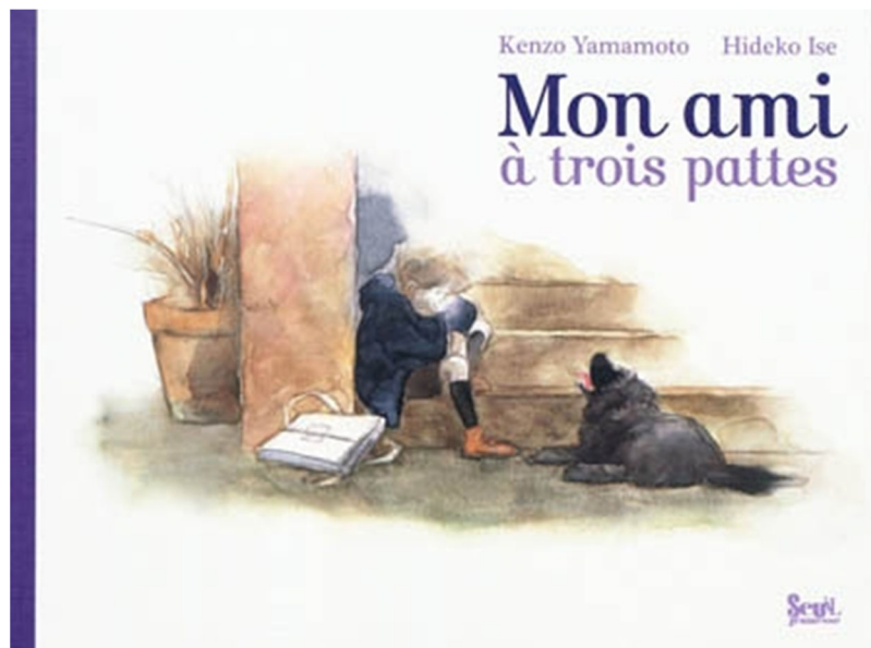
fig. 2 : Yamamoto, K. et Ise, H. (2010). Mon ami à trois pattes . Couverture.

C'est avec ce regard sémiotique sur les nombres comme relations que j'ai examiné un corpus de deux-cent-soixante-et-un ouvrages, archivés pour la plupart au Fonds de littérature jeunesse Bermond-Boquié situé à Nantes (corpus NLJ20210407 dans Gobert (2021)) et à qualifier en termes d'usages des nombres les jeux sémiotiques pratiqués avec les entiers naturels par les auteurs et les illustrateurs des ouvrages consultés. Dans ce contexte, un usage est une sémiose qui déroule une chaîne de signes en relation les uns aux autres et canalise les interprétations en cohérence avec une narration . J'ai explicité à partir de ce corpus les usages Quantifications, Mesurages, Numérotations, Graphismes et Langages (catégorisation amenée à évoluer en fonction de l'extension du corpus et de nos connaissances), les deux derniers usages Graphismes et Langages constituant l'un des apports de ma recherche au regard des autres usages plus communs. L'usage Langages concerne les jeux avec le langage, avec les sons, les mots, les lettres qui se lient aux nombres au sein de la narration, sans considération des autres usages, c'est-à-dire quand les chaînes sémiotiques sont canalisées dans et par le langage plutôt que dans et par le renvoi à un autre usage. Par exemple dans le récit de Kenzo Yamamoto et Ise Hideko Mon ami à trois pattes (fig. 2), si le mot « trois » renvoie à une quantification, la chaîne sémiotique narrative focalise sur autre chose.