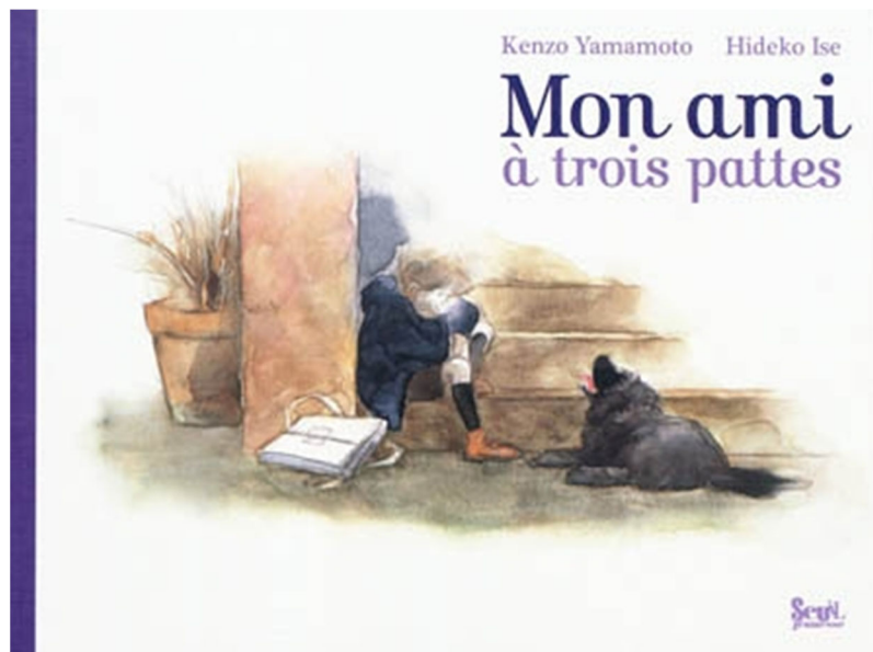
fig. 2 : Yamamoto, K. et Ise, H. (2010). Mon ami à trois pattes . © Seuil. Couverture.

C'est avec ce regard sémiotique sur les nombres comme relations que j'ai examiné un corpus de deux-cent-soixante-et-un ouvrages, archivés pour la plupart au Fonds de littérature jeunesse Bermond-Boquié situé à Nantes (corpus NLJ20210407 dans Gobert (2021)) et à qualifier en termes d'usages des nombres les jeux sémiotiques pratiqués avec les entiers naturels par les auteurs et les illustrateurs des ouvrages consultés. Dans ce contexte, un usage est une sémiose qui déroule une chaîne de signes en relation les uns aux autres et canalise les interprétations en cohérence avec une narration . J'ai explicité à partir de ce corpus les usages Quantifications, Mesurages, Numérotations, Graphismes et Langages (catégorisation amenée à évoluer en fonction de l'extension du corpus et de nos connaissances), les deux derniers usages Graphismes et Langages constituant l'un des apports de ma recherche au regard des autres usages plus communs. L'usage Langages concerne les jeux avec le langage, avec les sons, les mots, les lettres qui se lient aux nombres au sein de la narration, sans considération des autres usages, c'est-à-dire quand les chaînes sémiotiques sont canalisées dans et par le langage plutôt que dans et par le renvoi à un autre usage. Par exemple dans le récit de Kenzo Yamamoto et Ise Hideko Mon ami à trois pattes (fig. 2), si le mot « trois » renvoie à une quantification, la chaîne sémiotique narrative focalise sur autre chose.