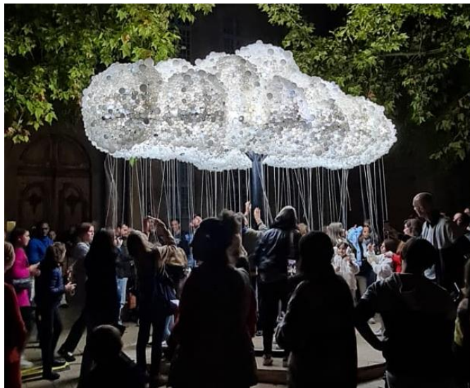
© « Cloud », Caitlind R.C. Brown & Wayne Garrett

Au programme : des expositions, des installations, des concerts, des performances et des œuvres installées dans l'espace public, avec comme point commun la culture numérique, autant dans les méthodes employées par les artistes que dans les contenus exprimés par les œuvres et poussant les publics à la réflexion sur leurs propres pratiques numériques.