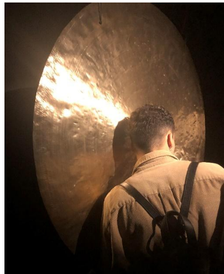
© « D'un soleil à l'autre », Stéphane Thidet

« Chroniques » constitue le terrain d'enquête d'une recherche empirique que nous menons sur les arts numériques, spécifiquement sur les arts numériques interactifs et immersifs , qui selon nos hypothèses, contribuent à renouveler les publics et les réceptions des arts et de la culture. En effet, en fonction de leurs implications variables et relatives aux œuvres, les publics sont amenés à ne pas uniquement adopter une posture contemplative mais à interagir, participer à la production de l'œuvre et être plongés dans des univers artistiques spécifiques créés à partir d'outils numériques et de programmes informatiques. Du fait de leurs caractéristiques interactives et immersives, les œuvres permettent ainsi aux publics de vivre des expériences inédites et implicatives , par exemple dans « Cloud », où les participants sont invités à allumer ou éteindre eux-mêmes les ampoules qui constituent le grand nuage blanc au-dessus de leurs têtes. Certaines de ces expériences font la une pour leur caractère à la fois novateur et grand public, comme « Sparks », une installation de dizaines de milliers de bulles de savon éclairées dans la nuit par des faisceaux de lumière colorées et présentée comme une alternative numérique et écologique aux feux d'artifices.