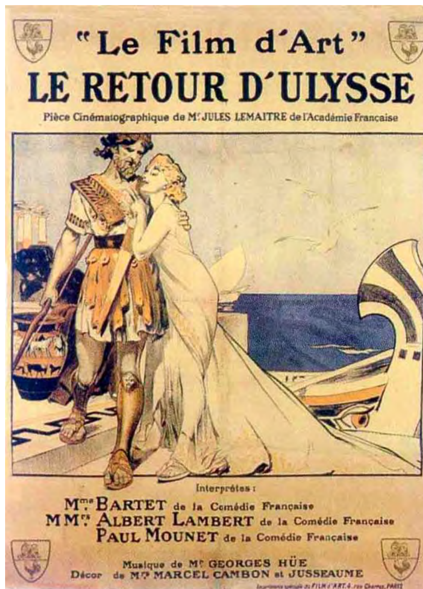
Fig. 3. Publicité de Film d'Art. Source : Mounet-Sully et Paul Mounet.