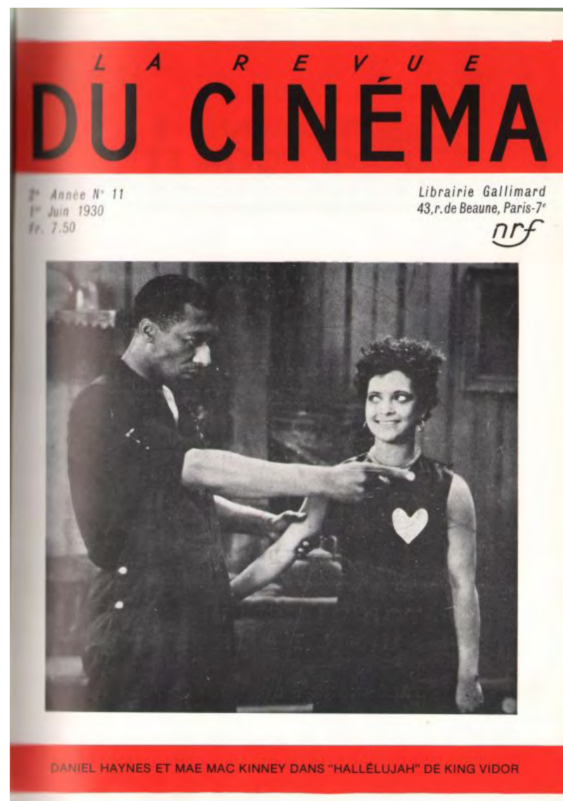
Fig. 2. Portrait et nom d'auteur en couverture de La Revue du cinéma (1930).