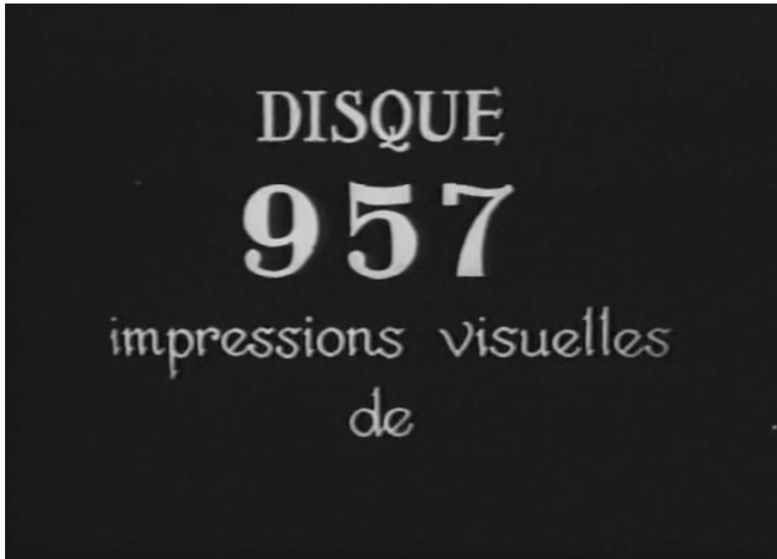
Vidéo 3 « Impressions visuelles de Germaine Dulac » : Disque 957 (1928).