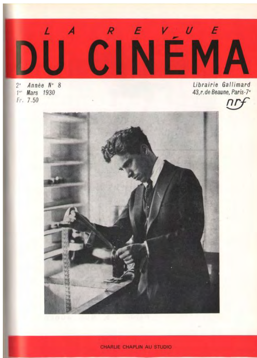
Fig. 1. Portrait et nom d'auteur en couverture de La Revue du cinéma (1930).