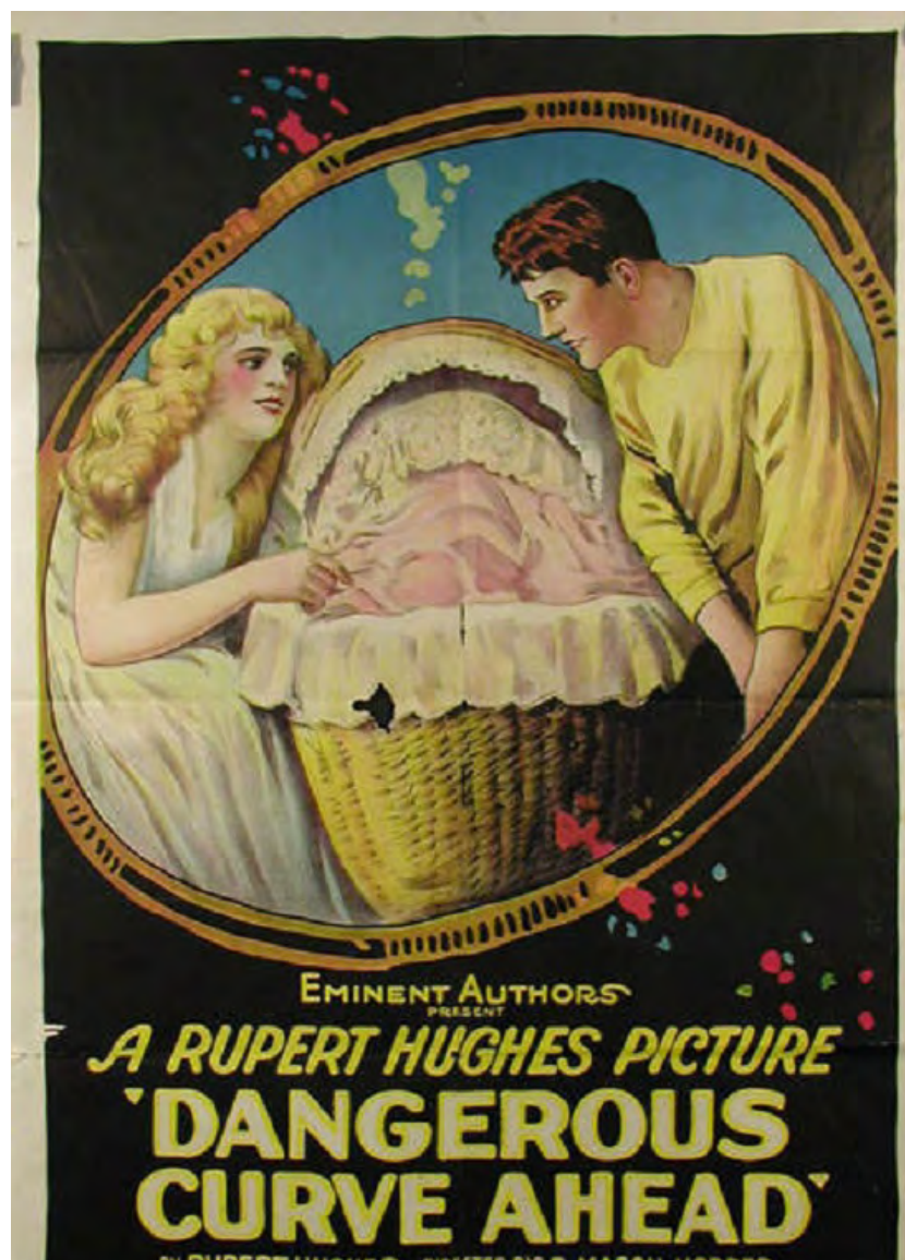
Fig. 4. Publicité de Eminent Authors.