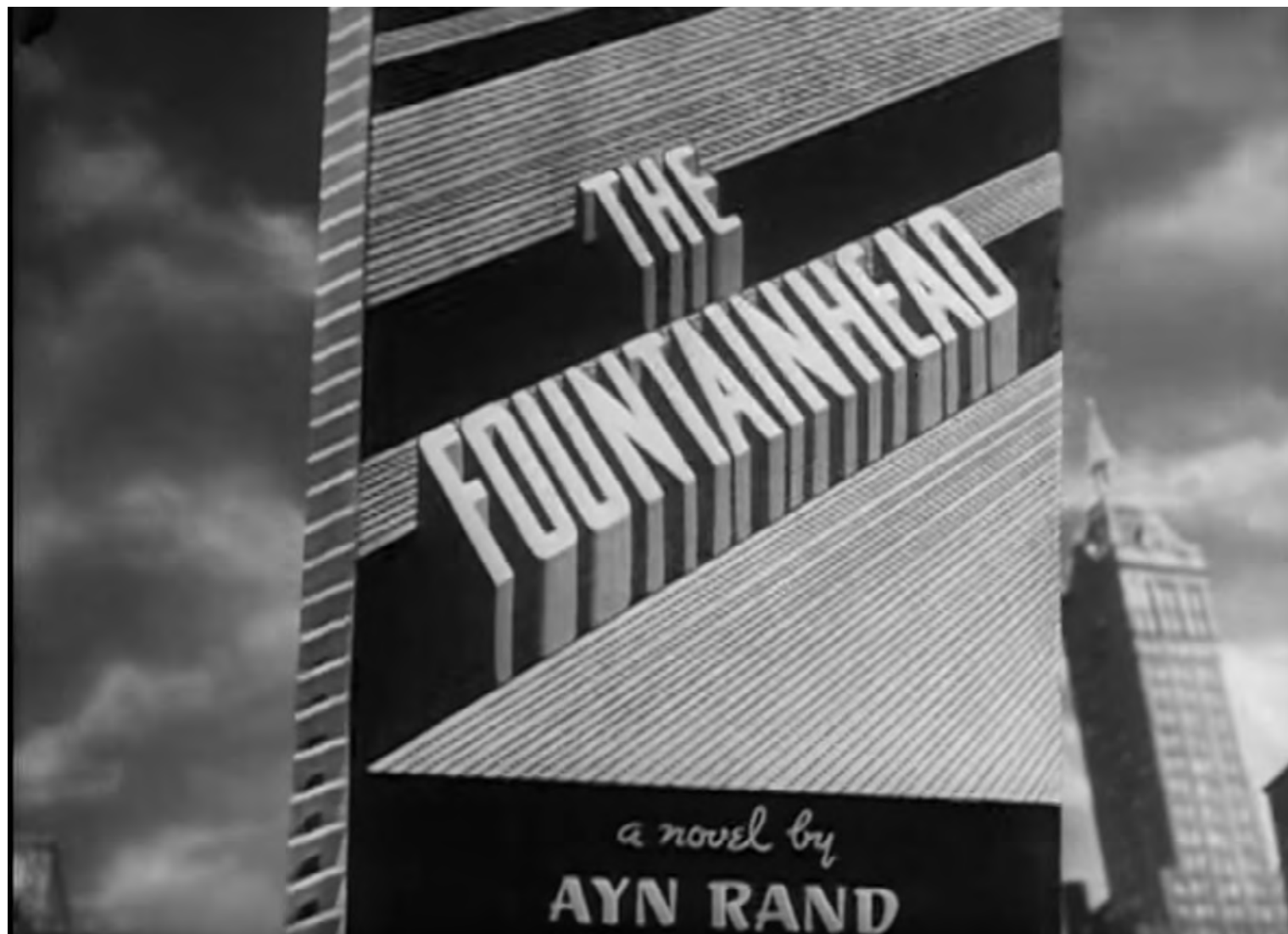
Vidéo 2 Bande-annonce d'un livre-film d'Ayn Rand : The Fountainhead (1949).