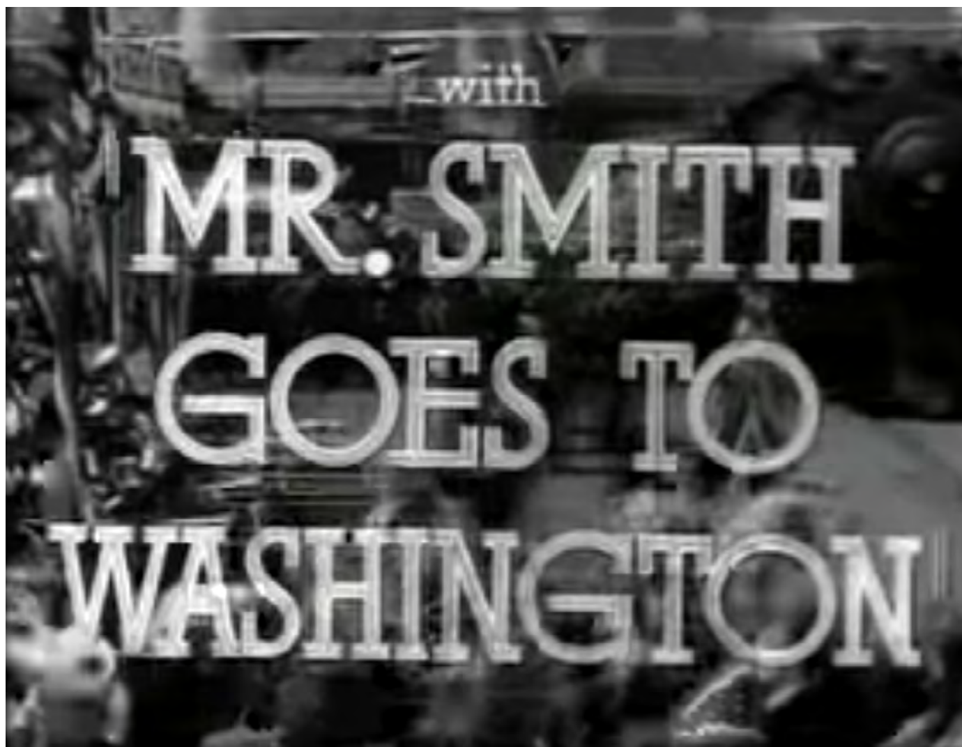
Vidéo 5 Bande-annonce d'un film de Frank Capra : Mr. Smith Goes to Washington (1939). Source : YouTube.