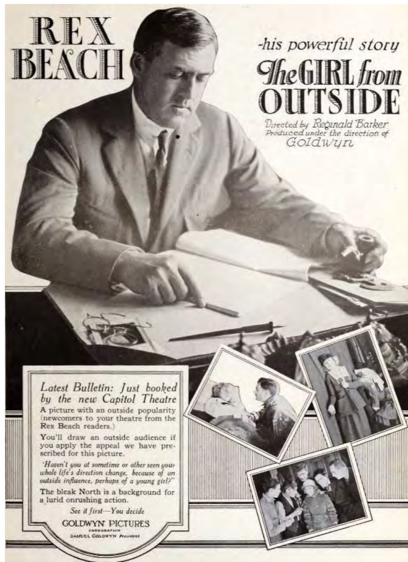
Fig. 5. Publicité de Eminent Authors.