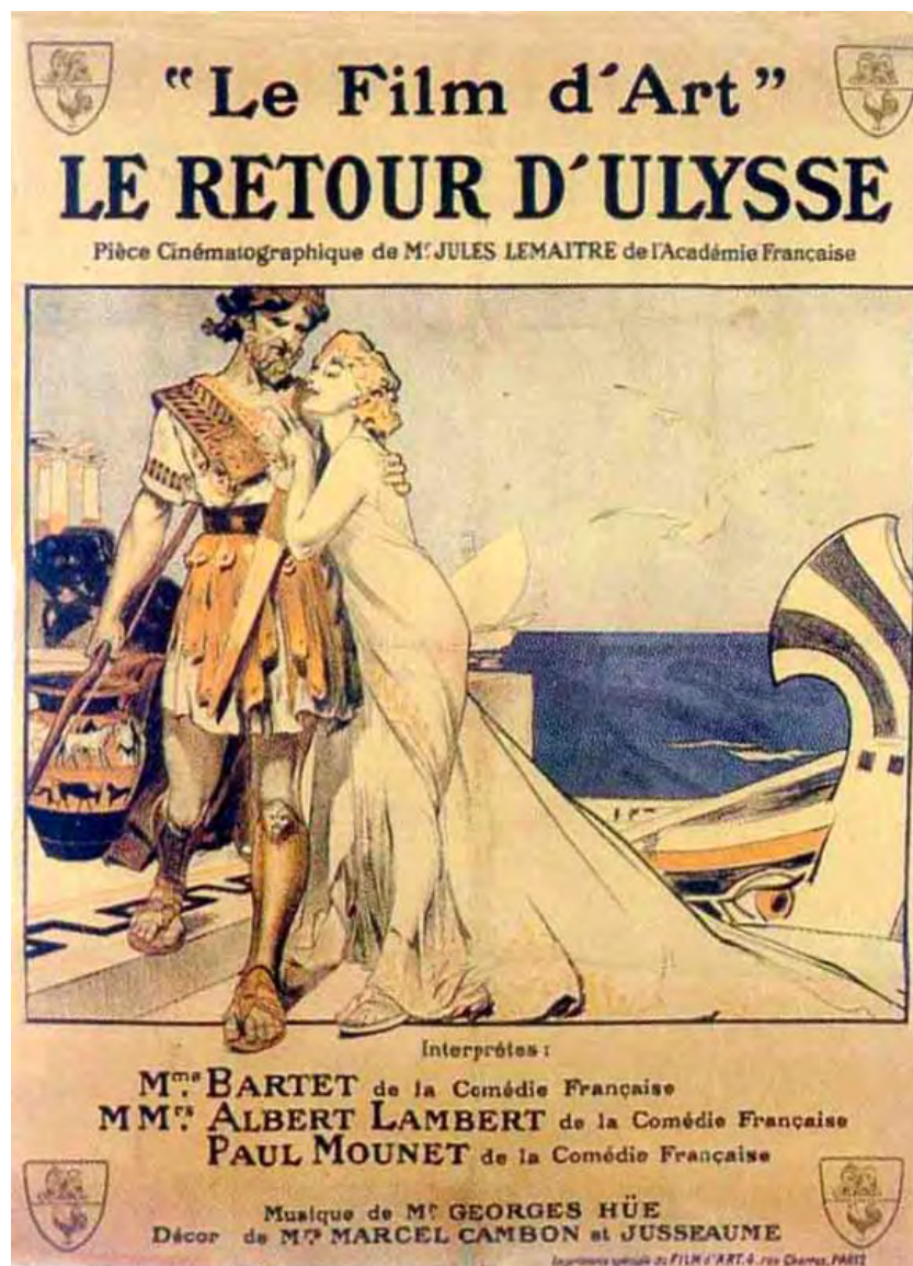
Fig. 3. Publicité de Film d'Art. Source : Mounet-Sully et Paul Mounet.