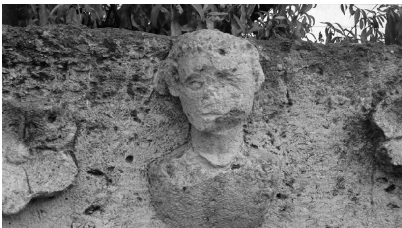
5-6 Porte de tombeau présentant un personnage en buste, Ham, II e s. de n. è. Amman, Musée archéologique de l'Université de Jordanie