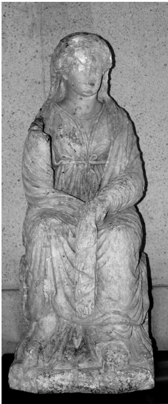
4 Statue funéraire féminine, Sidon, I er -II e s. de n.è. Beyrouth, Musée National