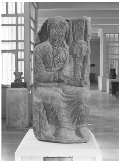
10 Stèle de la musicienne, Philippopolis (Shahbā), III e s. de n. è. Souweida, Musée de Souweida inv. 281

les-ci paraissaient, sous l'effet de la Seconde Sophistique, indispensables à l'exercice des magistratures 118 . Le portrait funéraire de Bôdostartos représenté en pepaideumenos pourrait ainsi trouver un de ses pendants féminins dans une stèle anépigraphe, taillé dans le basalte et provenant de Philippopolis (actuelle Shahbā) en Syrie du Sud 119 . Ce haut-relief (fig. 10), dont l'aspect n'est pas sans rappeler la statue de la dame sidonienne mentionnée plus haut, figure un personnage féminin assis sur un siège à haut dossier ( cathedra ), dont l'arrière n'est pas travaillé et dont le pied visible est orné sur toute sa hauteur de motifs circulaires (imitant des pierreries ou des incrustations de perles, ou encore des appliques en bronze?) 120 . La jeune femme est représentée le torse de face, les jambes tournées vers la gauche. Elle porte un chitôn à manches ceinturé sous la poitrine et un himation , parcouru de plis épais, enveloppant le bas du corps jusqu'aux chevilles, et duquel dépassent des pieds chaussés. La tête, nue, a été martelée, mais laisse deviner des traits juvéniles. Les cheveux sont