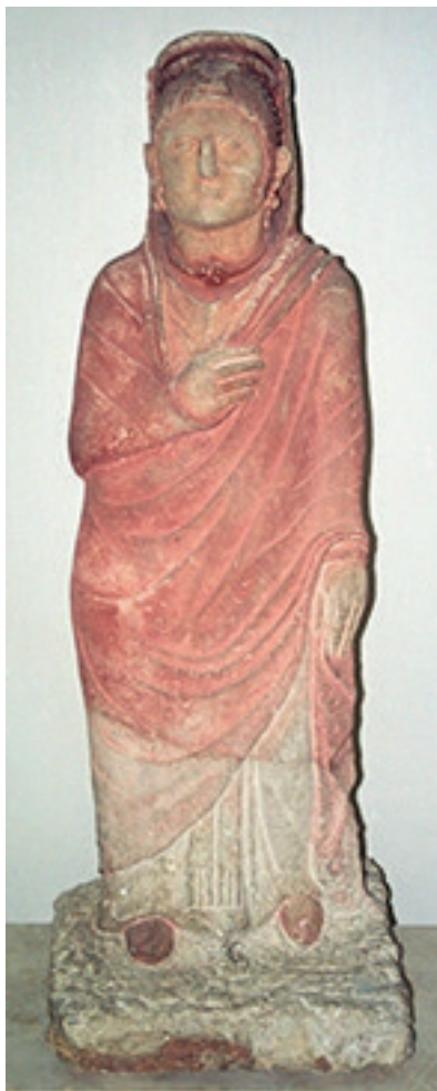
10b – Statue de «prêtresse» du tombeau de Ḥabbaši (Ḥama), début du II e s. de n. è. Damas, Musée National