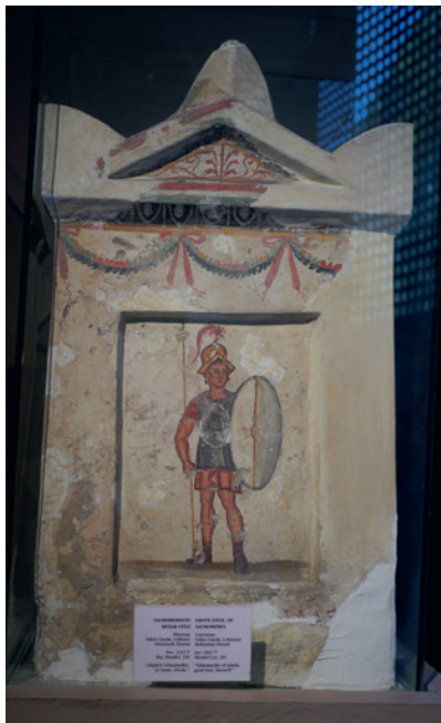
10a – Stèle funéraire de Salmamoas d'Adada, Sidon, III e –II e s. av. n. è. Istanbul, Musée archéologique inv. 1167 T