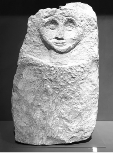
1 Relief funéraire phénicien, Phénicie, Âge du Fer II. Beyrouth, Musée National