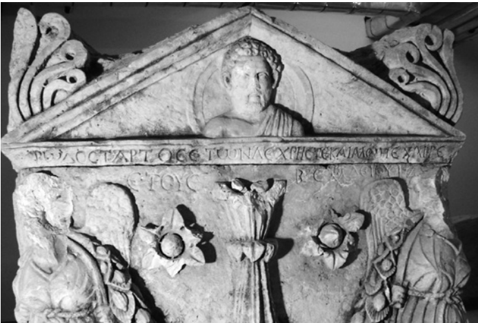
7-8 Sarcophage de Bôdostartos, Deb'aal, 136 de n. è. Beyrouth, Musée National