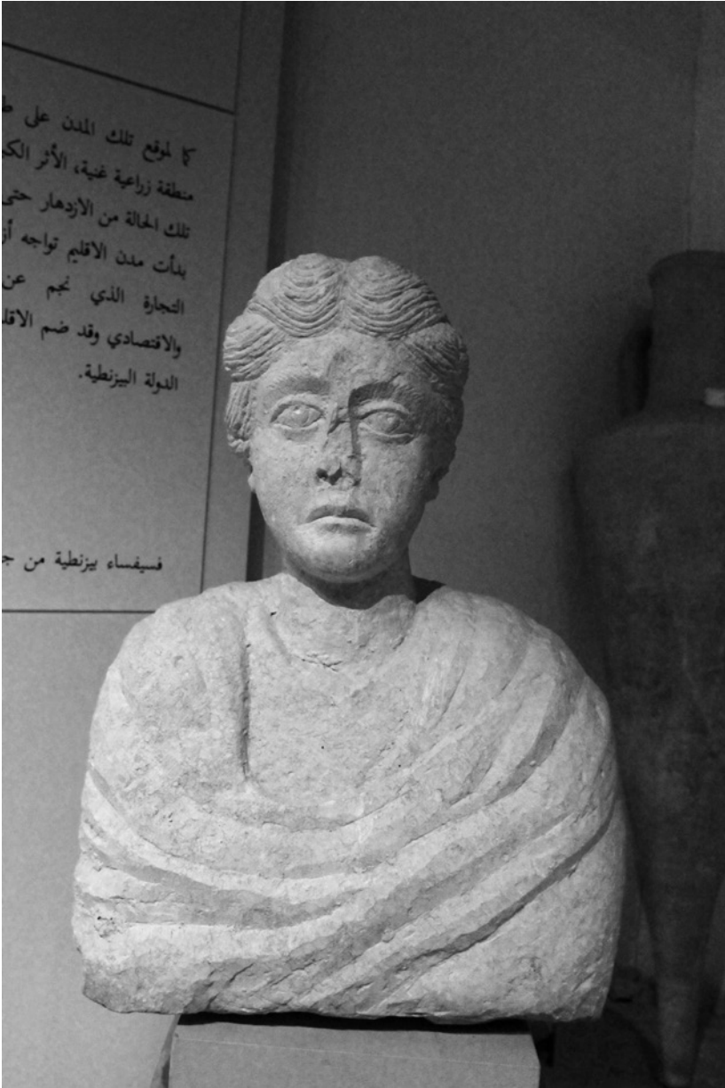
11 Buste d'une dame, Gadara (Umm Qeis), deuxième moitié du II e s. de n. è. Irbid, Museum of Jordanian Heritage, Université du Yarmouk, inv. A 3508/608