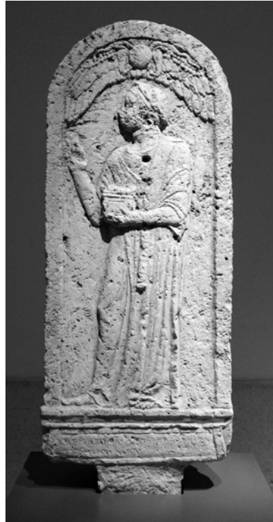
2 Stèle de Ba'alshamar, chef des portiers, Oumm el-'Amed, III e -II e s. av. n. è. Beyrouth, Musée National inv. 2072

lem, datée du milieu du III e s. av. n. è., qui montre un chasseur à cheval, sur le point d'assener le coup de grâce à un léopard (pl. 9) 8 .