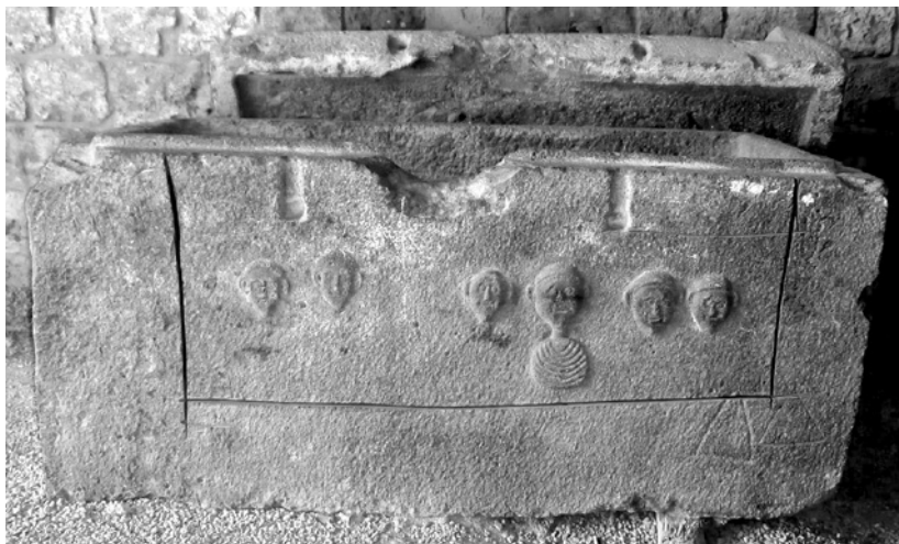
9 Sarcophage en basalte orné de portraits, Menjez (?), II e -III e s. de n. è. Tripoli, Citadelle de Tripoli

paideumenos , c'est-à-dire en homme ›cultivé‹, marquant son goût pour la paideia grecque 99 . Le médaillon ou clipeus aurait, quant à lui, une fonction héroïsante 100 .