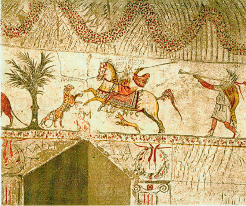
9 – Fresque représentant un cavalier chassant un léopard dans la tombe d’Apollophanès, Marisa, III e s. av. n. è. in situ