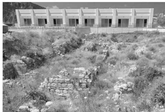
Fig. IX.3.3. Kephalos, resti in proprietà Kokkalaki, stato attuale, vista da N-E.

cui cinque completamente indagati. I corpi di fabbrica sono delimitati da quattro strade, e si dispongono lungo un'asse centrale, orientato E-O. Questa direttrice ha larghezza oscillante fra i 3,30 e i 3,40 m, è stata messa in luce per una lunghezza di 45 m. Essa sembra avere un andamento parallelo alla costa e alla strada interna principale già menzionata, corrispondente alla provinciale Kos-Kephalos. L'asse viario della proprietà Perou si incrocia perpendicolarmente con le altre quattro strade minori, parallele fra loro, con orientamento N-S e larghezza inferiore (da 1,50 a 1,90 m). Un'altra porzione di un importante asse, di cui però non si può affermare con certezza il collegamento con quello rinvenuto in proprietà Perou, è quella nel terreno Kokkalaki 1260 : qui è stato individuato un grande edificio di incerta identificazione, delimitato a N da una strada con larghezza variabile da 2,23 a 2,37 m, portata in luce per ca. 7 m. La sua pavimentazione è costituita da lastre ortostate in pietra in un buon numero di punti, ma la gran parte del manto è composta da piccole pietre irregolari. La direttrice si incrocia con un'altra strada sul limite ovest del saggio, con direzione N-S e larghezza inferiore, che conduceva verso il mare.