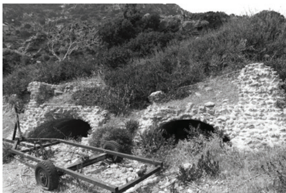
Fig. IX.3.2. Kephalos, Kamari, area del porto, ambienti voltati in opus incertum , vista da N-E.