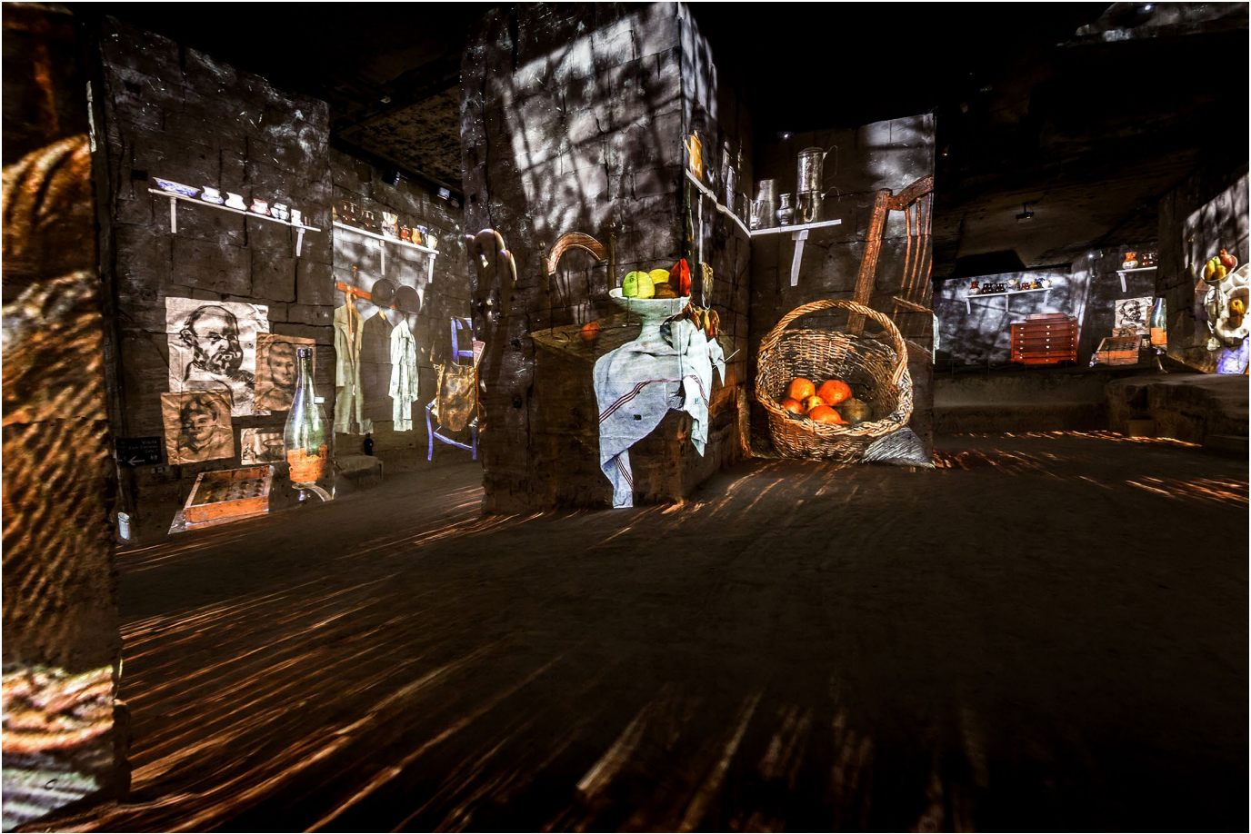
L'exposition immersive Cézanne, le maître de la Provence (2021), aux Carrières de lumières , produite par Culture Espaces, est un exemple de stimulation du sens de la proprioception.

prime et reste le vecteur d'accès à l'expérience proposée. De la même manière, des dispositifs numériques immersifs composés de projections vidéos et/ou d'un nombre important d'écrans peuvent se révéler intéressants du point de vue du sens de la proprioception, autrement appelée kinesthésie, c'est-à-dire la perception consciente des mouvements des différentes parties du corps. C'est le cas, par exemple, à l'Atelier des Lumières (Paris), ou dans la scénographie choisie pour l'exposition immersive La Joconde (Marseille), produite par le Grand Palais Immersif. L'immersion est liée à l'engagement du corps du visiteur : au sein d'une muséographie immersive, le visiteur est supposé éprouver le lieu et l'exposition avec l'ensemble de ses composantes physiques, sensorielles et corporelles. Le visiteur visite le musée, mais il le vit aussi. Néanmoins, ces formes muséographiques n'offrent aucune place au sens du toucher, et la vue reste le sens qui domine l'expérience. Elles restent donc, en l'état, tout à fait inadaptées aux besoins exprimés par les personnes déficientes visuelles.