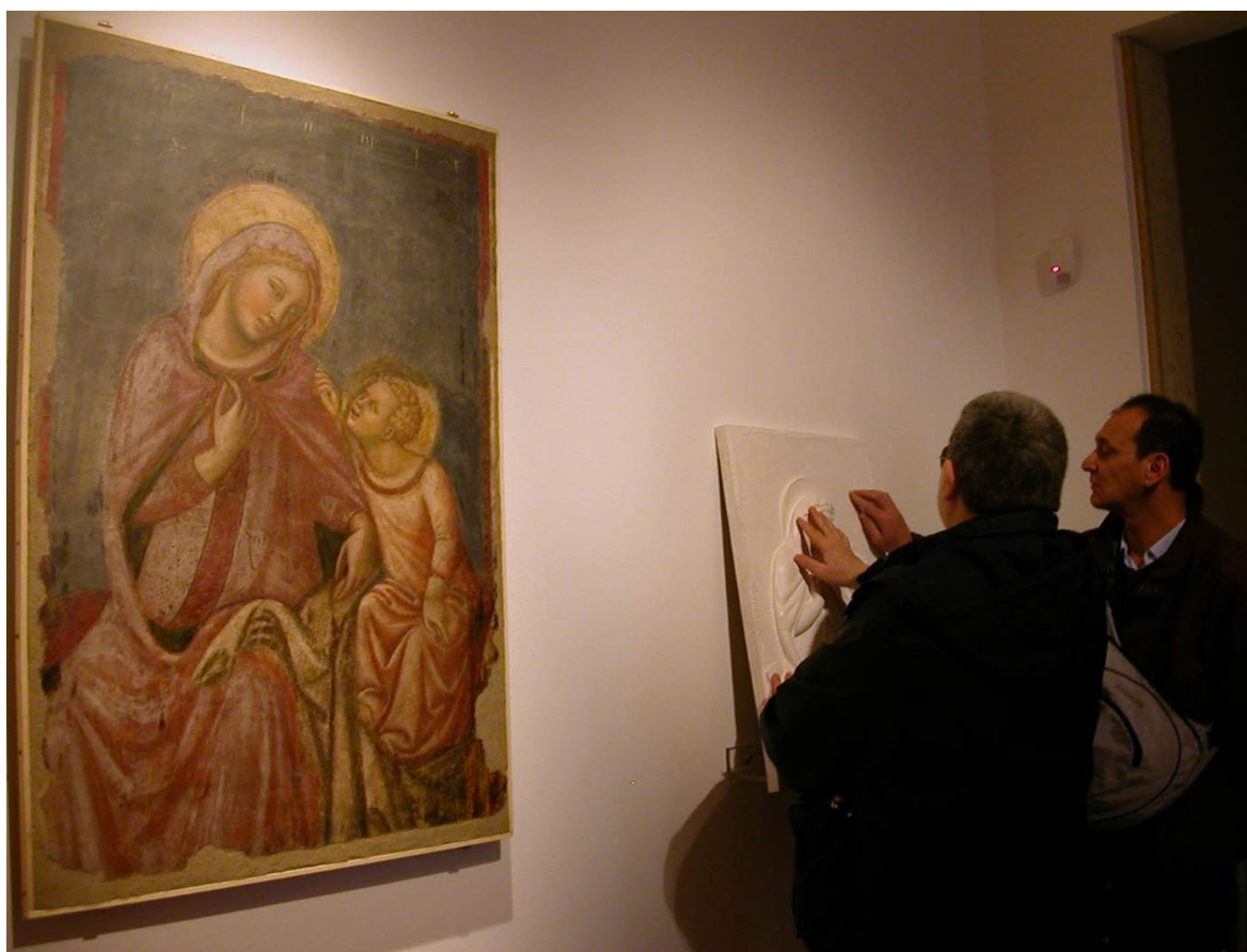
Visiteurs déficients visuels au musée tactile Anteros à Bologne (Italie).