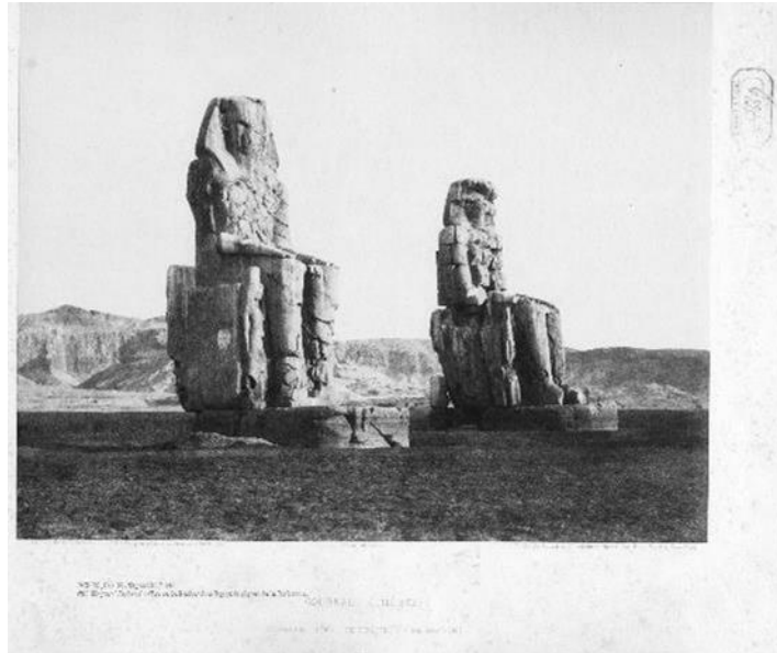
Figure 3 : F. TEYNARD, planche 44 : « Karnak (Thèbes), Vue générale des ruines prise du point B ». Tampon du Dépôt Légal Seine (1853). Numéro d'inventaire 8677. (Un numéro erroné est conservé en dessous (« 8676 »)).

La planche complète est d'une hauteur de 40 cm et d'une largeur de 52 cm, ce qui correspond à un format A2. Au centre de ce grand cadre, l'image est d'une hauteur de 24 cm et d'une largeur de 30,3 cm. Chaque planche est référencée et légendée, permettant une identification claire du site. Le pays est mentionné en haut de planche, le site sous la photographie (exemple de la planche 44 en illustration 3 : « Égypte - Karnak (Thèbes), Vue générale des ruines prise du point B »).