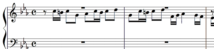
Illustration 8 : Début de la fugue BWV 847