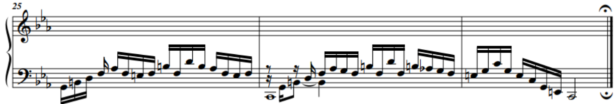
Illustration 5 : Fin du prélude BWV 847, dans la version du Clavier-Büchlein de Wilhelm Friedemann Bach.

Les indications de tempi , rares dans Le Clavier bien tempéré , ici contrastées et rapprochées, les arpèges, le récitatif de main droite mes. 34, les changements d'écriture, tous ces éléments renvoient à l'esprit virtuose, inventif et improvisé qui caractérise le stylus fantasticus . Ils contribuent aussi à dramatiser un prélude qui fut d'abord un exercice pour les doigts et la mémoire musicale de Wilhelm Friedemann Bach. Dans cette première version, les mesures 26-34 et 36-38 n'existaient pas. Bach passait directement de la mes. 25 à la mes. 35, sans changement de tempo, pour terminer avec un simple arpège descendant (Illustration 5).