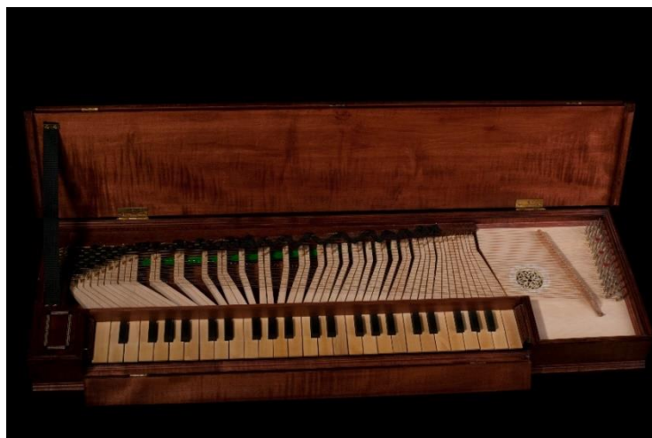
Illustration 3 : Clavicorde lié. Copie d'un instrument d'Israel Gellinger (1670), par Pierre Verbeek.

Le clavicorde est un instrument pédagogique couramment employé dans l'environnement musical de Bach. De nombreux maîtres de musique, de Virdung (1511) 7 à Griepenkerl (1820) 8 , le recommandent pour l'étude du clavier : il nécessite en effet un parfait contrôle de la vitesse d'attaque et de la profondeur d'enfoncement. Si les clavicordes du XVII e et du premier XVIII e siècle sont souvent des clavicordes dits « liés » 9 (Illustration 3), sur lesquels jouer dans les tonalités avec de nombreuses altérations reste assez délicat, la facture du clavicorde se perfectionne en Allemagne au cours du siècle, avec un élargissement du clavier et le développement d'instruments de plus grande taille, non liés, qui permettent d'interpréter des pièces chromatiques et dans tous les tons plus aisément. Cela étant, ces grands instruments restent rares avant 1740.