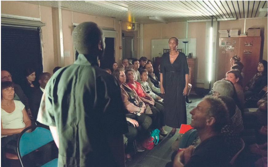
Figure 1 – Représentation de la pièce We Call It Love à Sevrans le 20 septembre 2015.

selon laquelle le théâtre contemporain n'intéresserait qu'une toute petite élite est fausse. En revanche pour beaucoup, les théâtres sont intimidants, alors que dans l'intimité des maisons, le canal de l'écoute et de l'échange s'ouvre bien plus facilement. Carole et son équipe ont amené cette parole rwandaise avec une grande douceur, la pièce a eu beaucoup de succès et a suscité de très nombreux échanges.