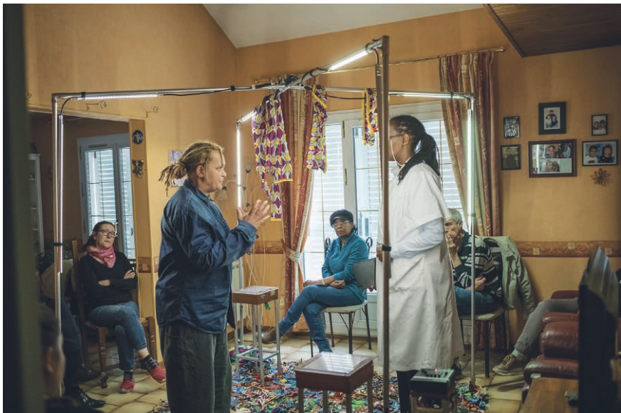
Figure 2 – Représentation à domicile de la pièce Murs-Murs en 2018.

V. S. : Nombreuses sont les personnes qui nous disent retrouver un espace de débat à l'occasion des représentations que l'on fait chez eux. Il faut dire quelques mots de la manière dont celles-ci se déroulent. En amont, il y a un temps de repérage, durant lequel nous rencontrons les gens chez qui nous allons jouer, souvent par l'intermédiaire de leurs voisins ou amis, chez qui nous avons déjà joué auparavant. Nous nous adressons vraiment à des personnes plutôt qu'à des masses, d'ailleurs nous ne parlons pas de public ou de spectateurs, mais plutôt d'habitants ou de participants. Le jour même, on installe la scénographie avec l'équipe artistique, on joue pendant une heure environ, ensuite un débat plus ou moins de la même durée a lieu, suivi d'un temps convivial de collation, voire de repas. Le débat intervient donc après la catharsis théâtrale. Cette catharsis ne peut pas s'opérer sans une grande exigence artistique.