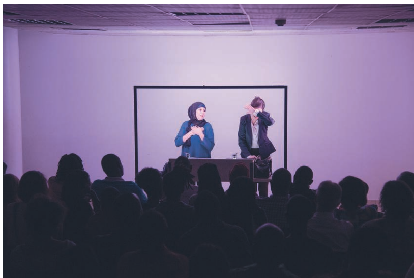
Figures 3 et 4 – Représentation de la pièce « Je suis une femme mais je me soigne » à la Kigali Public Library en 2017.