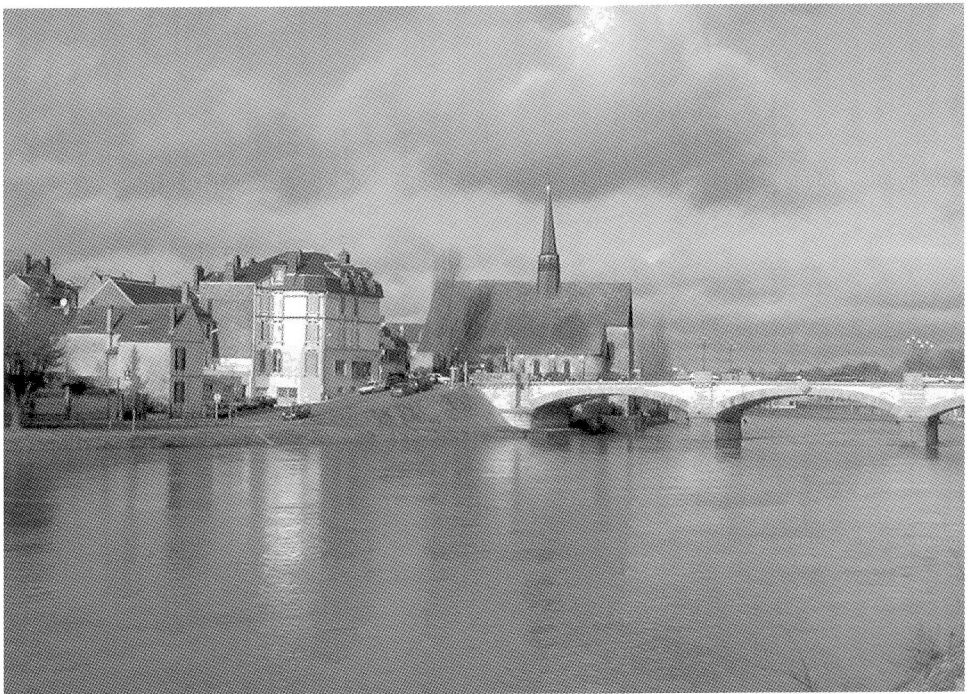
Fig. 2. Lieu de découverte de l'inscription dans le grand bras de l'Yonne.