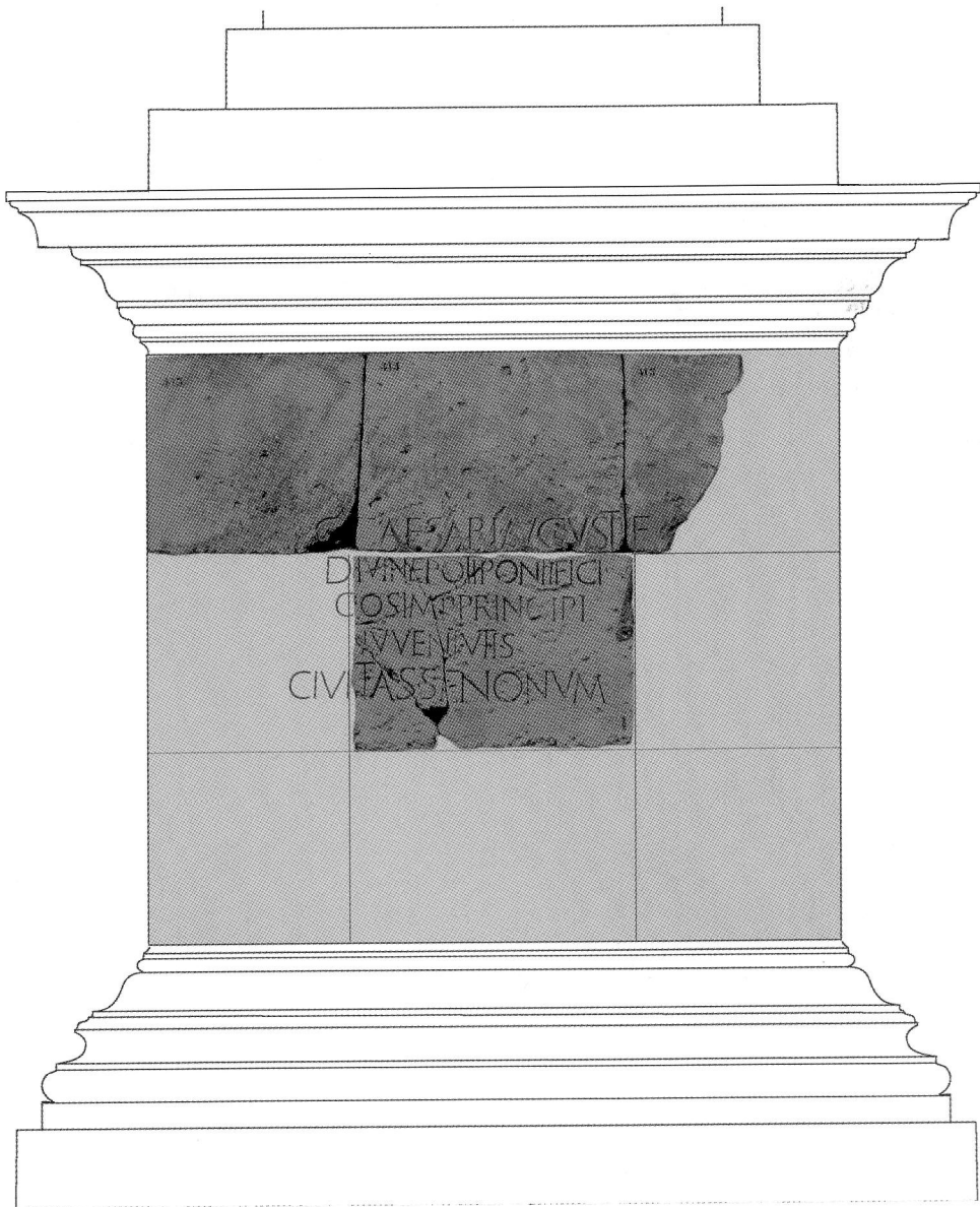
Fig. 7. Essai de restitution de la base portant l'inscription de Caius César (dessin B. Debatty).