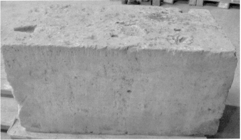
Fig. 3. Bloc 1. Face latérale gauche.