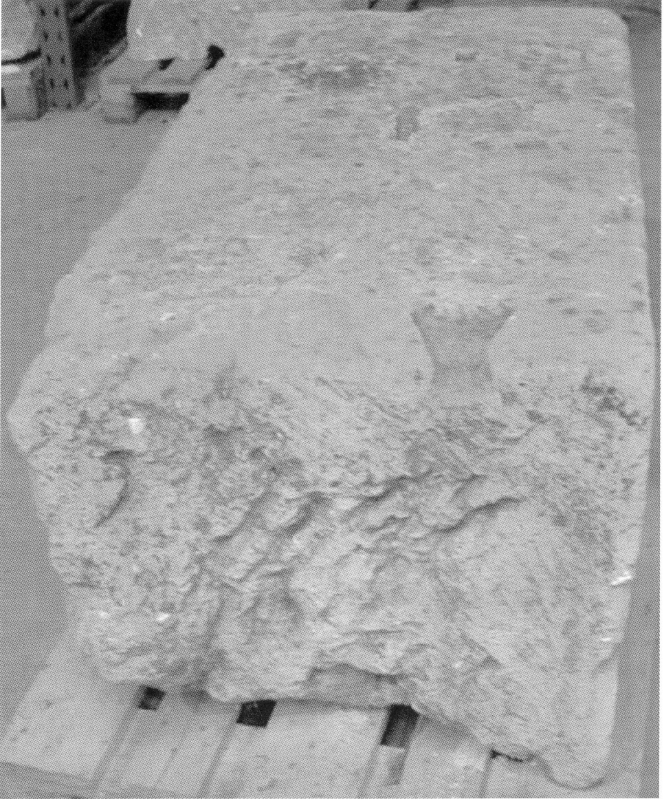
Fig. 5. Bloc 1. Face arrière.