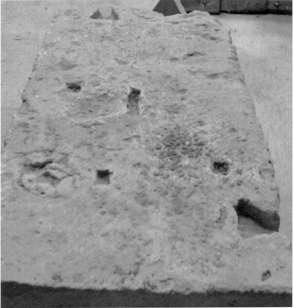
Fig. 6. Bloc 1. Face supérieure.