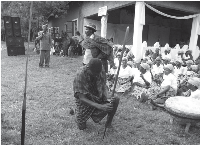
Ph. 6 : Le maître de cérémonie (MC), à l'aide d'un micro et d'un puissant haut-parleur, dirige la cérémonie tandis qu'au premier plan, un guerrier plante une lance au sol (inauguration de l'assistant du chef suprême des Kilovio, à Singisi, le 1 er juillet 2010).

Autre évolution notable, la mise en œuvre des moyens modernes de communication. On envoie volontiers un carton d'invitation aux notables, et le programme de la journée est tapé à la machine sur une feuille blanche distribuée sur place. L'horaire y est même précisé, bien qu'il ne soit jamais respecté. Une sonorisation est installée, avec de puissants haut-parleurs et un micro. Un maître de cérémonie (MC) règle le déroulement des diverses étapes (photographie n°6) et souvent, un spécialiste vidéo vient filmer la scène pour composer un DVD qui sera vendu en mémoire de l'événement. Si la tenue des femmes n'a pas sensiblement changé (en général, c'est un corsage ou un tee-shirt, et un pagne masquant les jambes enroulé autour de la taille), la volonté d'être moderne se manifeste aussi dans les costumes-cravates flambant neufs qu'arborent désormais les hommes les plus en vue, ainsi que dans la contribution au progrès voulue par certains acteurs. La génération des Kakisha du village de Songoro en donne un bon exemple : lors de leur retraite en 2010, ces guerriers ont offert publiquement un lot de toilettes en porcelaine neuves pour les latrines de l'école primaire locale.