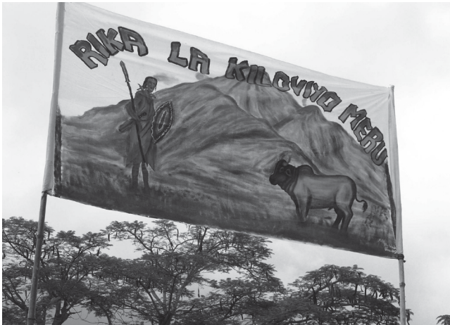
Ph. 1 : Le drapeau des Kilovio est arboré lors d'une cérémonie (inauguration de l'assistant du chef des Kilovio, à Singisi, le 1 er juillet 2010).

le début de l'histoire des Rwa (XVII e siècle) jusqu'à nos jours, 23 générations se seraient ainsi succédé sur une période d'environ quatre siècles. La mémoire de leurs noms est conservée. La dernière et vingt-troisième (en 2014) est la génération des Kilovio, qui a été mise en place à partir de 2005 (photographie n°1). L'inauguration d'une génération nouvelle marque son entrée « en exercice », c'est-à-dire qu'elle reprend le rôle de guerriers que tenait jusqu'alors la génération précédente. En effet, cette dernière a vieilli et ne peut conserver plus longtemps ce rôle martial. Le renouvellement périodique de la classe des guerriers est l'une des fonctions essentielles des systèmes d'âge en Afrique de l'Est. Chez les Rwa, comme chez les Maasai, par exemple, la génération la plus jeune est toujours celle qui détient ce rôle de guerriers. Elle est chargée de défendre le pays, voire d'attaquer les voisins, et de récupérer le bétail volé ou de voler celui d'autrui. Aujourd'hui, ces périodes d'hostilité sont révolues sur le mont Méru, aussi le rôle des guerriers a-t-il changé de nature, comme nous le verrons plus loin. Mais le statut de guerrier existe toujours et il est désigné par un terme, nsero (pl. wasero ) 5 , qui correspond à moran dans la langue des Maasai.