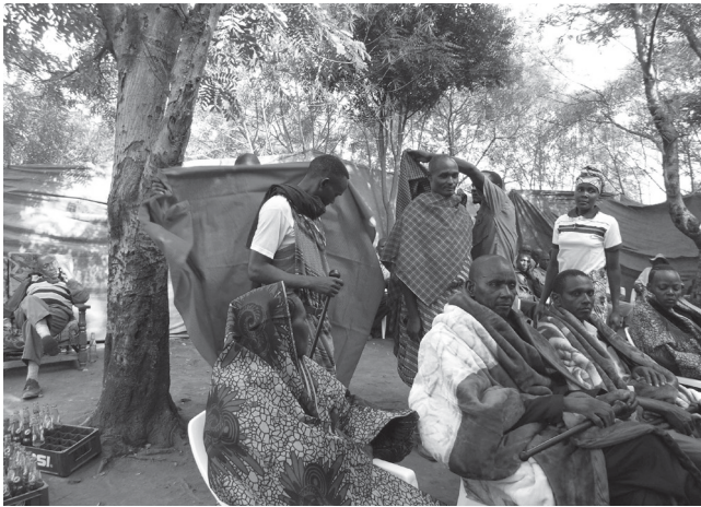
Ph. 5 : Après avoir honoré leurs « pères » par le don d'épaisses couvertures et les épouses de ces derniers par le don d'un pagne, les chefs des guerriers à leur tour reçoivent chacun une couverture plus légère, de style maasai (cérémonie de demande de circoncision des Kilovio à leurs « pères », à Migandini, le 1 er mars 2014).

Après cette première phase honorifique de la cérémonie, on procède au transfert symbolique des fonctions. Le chef de la génération sortante de guerriers en restitue les symboles, la lance et l'épée, et ces objets sont remis solennellement au futur chef des nouveaux guerriers. Le drapeau de la génération sortante est ensuite abaissé, tandis que celui de la génération nouvelle est brandi à sa place. On passe autour du cou des divers notables et chefs de grands colliers de bougainvillées, avant de se rendre au repas offert à tous par la génération sortante.