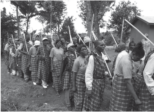
Ph. 4 : Les guerriers pour leur retraite aiment revêtir une tenue identique (retraite des Kakisha du village de Songoro, le 2 juillet 2010).

Prenons le cas de la cérémonie de retraite d'une génération, observée à trois reprises 18 . La génération qui va se retirer arrive sur les lieux en brandissant son drapeau. Elle s'installe, avant que la génération qui va la remplacer arrive à son tour en procession, précédée de ses « pères ». Ces jeunes hommes brandissent bruyamment leurs bâtons et leur tenue s'inspire de celle des Maasai : ils portent un pagne ou un tissu rouge noué sur l'épaule, qui s'ajoute à leurs chemise ou tee-shirt et pantalon habituels, ou bien ils sont tous habillés de la même manière, d'un tissu à carreaux acheté pour la circonstance (photographie n°4) 19 .