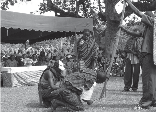
Ph. 2 : Lors de l'investiture du nouveau chef suprême, les guerriers plantent leurs lances et leur drapeau devant la tribune (à Poli, le 17 juillet 2010).

Les systèmes d'âge donnent un cadre aux rapports violents entre groupes rivaux, puisque ce sont deux catégories correspondantes de guerriers qui s'affrontent. On peut considérer ces antagonismes comme une forme de langage, dans la mesure où ils établissent des ponts entre des catégories équivalentes 8 . Cela présente l'avantage qu'en temps de guerre, comme nous l'avons vu, les protagonistes les plus faibles peuvent adopter le système de leurs ennemis pour ne pas disparaître. Ce processus transforme les ennemis en compagnons d'âge, entre lesquels le principe de solidarité prévaut. C'est donc un mécanisme de survie 9 , dont les exemples sont nombreux en Afrique de l'Est (Kurimoto et Simonse 1998 : 12).