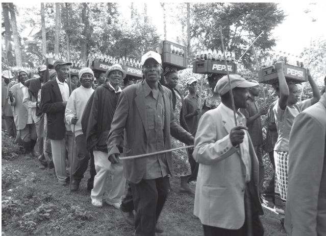
Ph. 3 : Les caisses de soda remplacent aujourd'hui la bière de banane (inauguration du chef des Kilovio du village de Ndoombo, le 3 juillet 2010).

Toutes ces cérémonies, qu'il s'agisse de la retraite d'une génération, de l'investiture d'un chef ou de la demande formelle d'autorisation de circoncision, se déroulent selon un processus similaire. Elles ne commencent jamais tôt, tout au plus en fin de matinée ou en début d'après midi, car il faut attendre que les invités soient arrivés, en particulier les notables, et certains viennent de loin. Une tribune est préparée, ou un rang de fauteuils en plastique, pour les personnalités les plus importantes, tandis que les autres s'assièront en face, sur des bancs ou des chaises, ou, à défaut, par terre. Les membres de la génération intéressée font leur entrée en procession, brandissant vers le ciel leurs bâtons de guerriers. Par-dessus leurs vêtements habituels, ils se drapent à cette occasion d'un tissu rouge à la manière des Maasai. C'est un rappel du passé en même temps qu'une forme de déguisement, car leur tenue est loin de ressembler vraiment à celle des Maasai (photographie n°2, 4 et 6). Dans certains cas, ces guerriers sont suivis de leurs épouses qui portent sur la tête les caisses de soda, en remplacement de la bière de banane consommée autrefois pour la circonstance (photographie n°3). Quand tout le monde est installé, une prière commune précède de longs discours de notables, avant que la cérémonie elle-même se déroule.