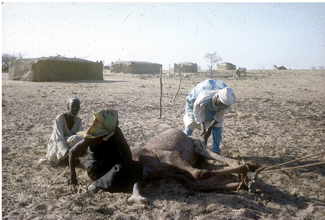
Photo 2. Marquage d'un chamelon dans un campement daza

La première conséquence de ce cycle d'échanges est la formation d'un troupeau nouveau, dont vivra le jeune couple (photo 2).