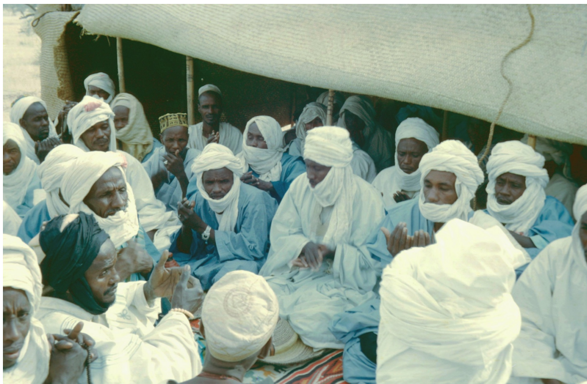
Photo 1. Les deux parentèles, face à face, prononcent la fatiha pour "attacher" le mariage (cliché C. Baroin, 1972)

Le lendemain, en fin d'après-midi, prend place la troisième et dernière phase du cycle matrimonial de transferts d'animaux. Les parents de la mariée qui ont bénéficié de la distribution des tewa se font donateurs à leur tour, au profit du marié. Ce sont des dons de gros bétail uniquement, appelés conofor , pl. conofora .