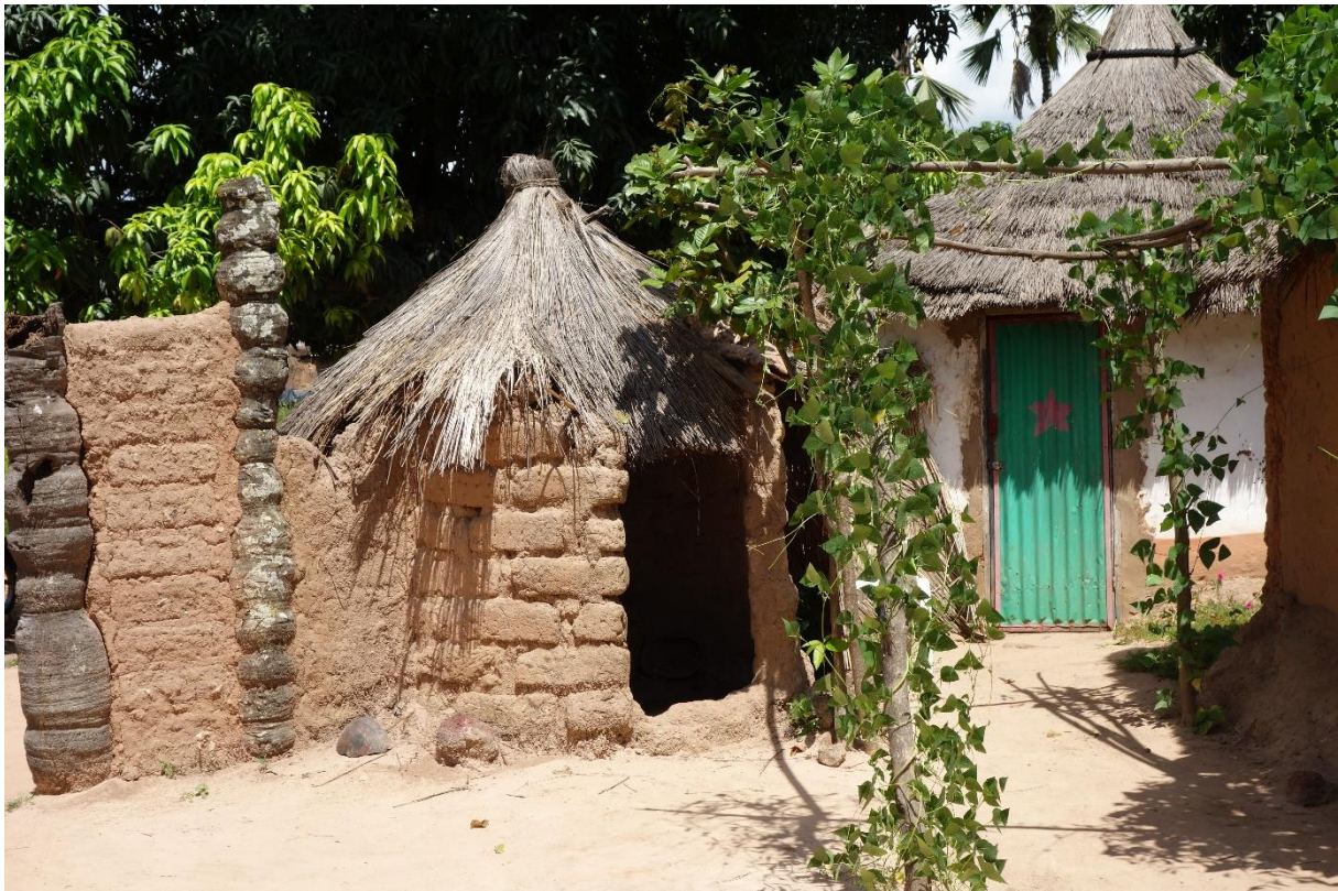
Figure 6. La maisonnette de divination

Un parcours rituel de plusieurs années commence alors pour le futur devin. Un autel est construit pour le génie mâle près de la case vestibule à l'extérieur de la concession et un autre pour le génie femelle dans une « maisonnette de divination » bâtie à cet effet dans la cour familiale (figure 6) 35 . Le devin offrira ensuite régulièrement des sacrifices à ces autels. Une puissance appelée Kutyon est « posée » dans la maisonnette du génie sous la forme d'un caillou, généralement une hache polie. Cette entité, un peu à part, ne reçoit jamais aucun sacrifice.