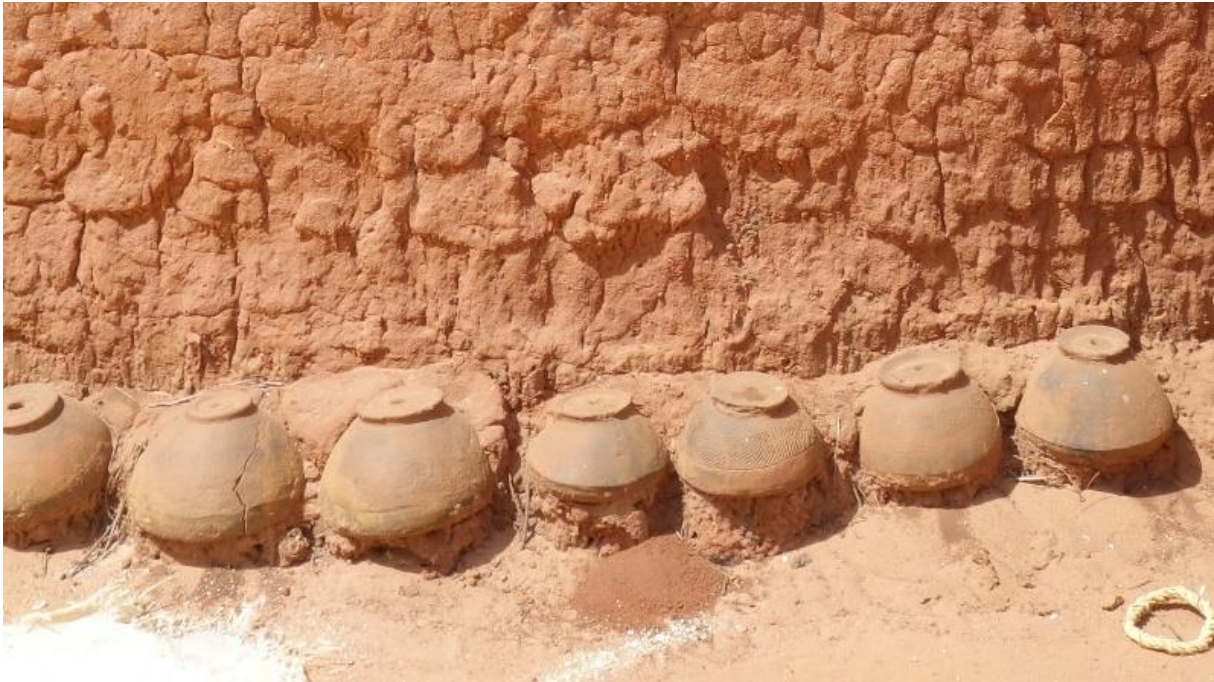
Figure 3 « Fétiches » de la Chance

« fétiches » qui te gardent 30 . Si quelque chose t'atteint, c'est que tes Choses Gardiennes t'ont lâché, sinon elles te protègent contre toutes les mauvaises choses. Si tu as des ennuis, des rêves bizarres, des maladies, des accidents..., c'est forcément parce qu'une ou plusieurs de tes Choses Gardiennes ( myen mē ) sont en colère » 31 .