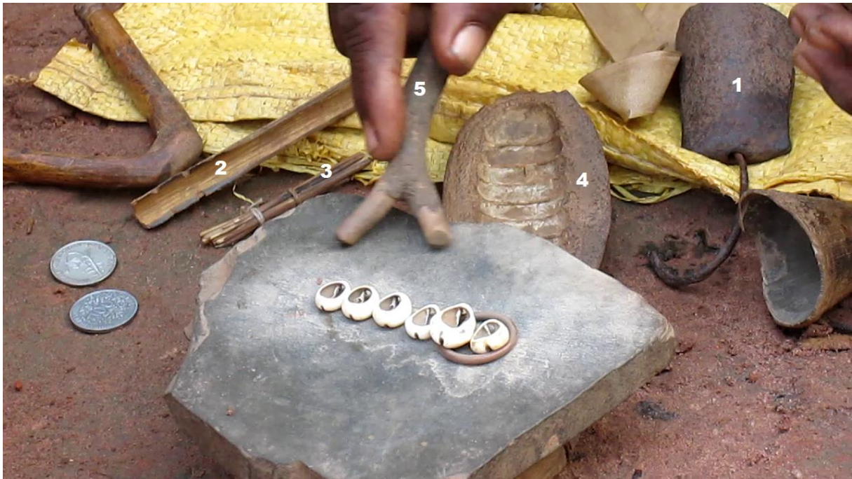
Figure 7. Objets rituels renvoyant à l'autorité du Dwo , de la Terre et au pouvoir des génies

observent que quand un détachement est fait lors d'un sacrifice, c'est à l'aide du couteau qui sert à égorger la victime.