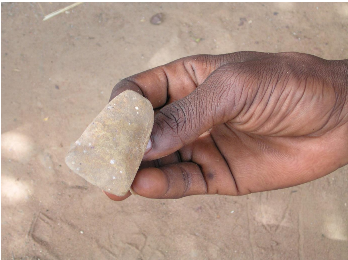
Figure 9. Objet servant à « poser » Kutyon dans la maisonnette du génie

l'importance que les Sèmè accordent à ces questions (voir l'annexe). Pour notre propos, ce qui importe c'est que par le jeu des incarnations successives de son nuon , toute personne est reliée à une longue chaîne d'ancêtres. Au cours de nombreuses existences, son nuon a été lié à différents groupes de Choses Gardiennes. Dans cette chaîne, les personnes les plus anciennes ne peuvent plus être identifiées par un nom et sont évoquées par le terme collectif de Kutyon . Kutyon est donc en quelque sorte la somme de tous ces ancêtres et dispose d'une perspective cavalière sur l'enchaînement des générations d'humains depuis le début des temps. À la différence des autres puissances, Kutyon n'est pas pensé comme attaché à une personne, il est la totalité des mémoires concernant tous les Sèmè. C'est pourquoi Kutyon est la clairvoyance même et c'est aussi pourquoi certains Sèmè se laissent emporter par l'emphase jusqu'à l'assimiler au dieu créateur. Les devins se dressent contre une telle affirmation et argumentent. Kutyon est certes en un sens plus savant que le dieu créateur qui, orchestrant l'ensemble de la création ( animaux, génies, eau, terre...), ne peut se perdre dans les détails. Kutyon ne connaît en revanche rien de l'avenir, savoir réservé au créateur. Pour bien faire comprendre ce qu'est