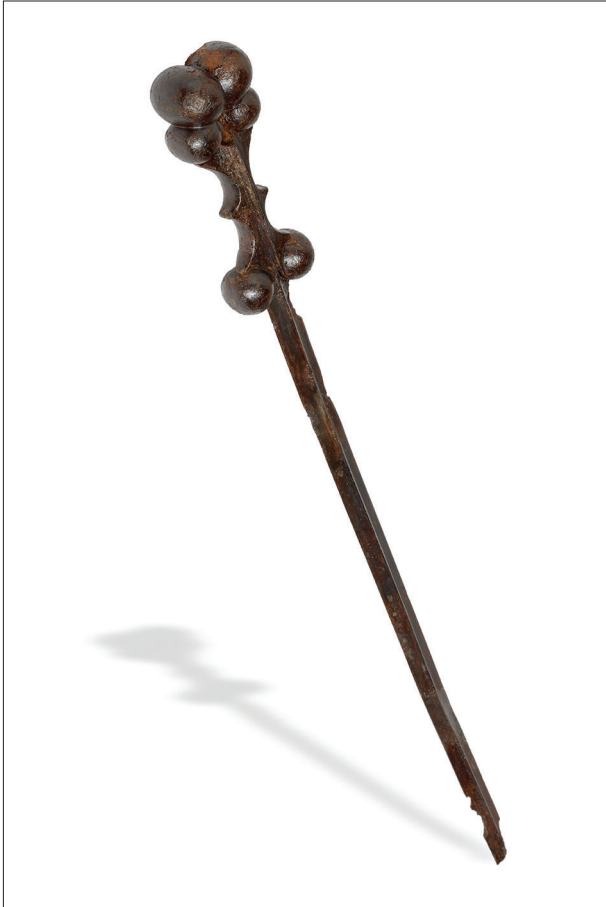
Fig. 3. Épée à sphères avec fourreau découverte dans la Loire à Nantes.

laténiennes du Pont de l'Ouen (Lisle du Dreneuc 1914 ; Lejars 2014) indiquent un lieu de passage et un espace attractif. Enfin, en rive droite de la Loire, à l'est, le sanctuaire antique de la Vieille Cour et les indices d'occupation gauloise de Mauves-sur-Loire (Monteil et al. 2009), constituent un autre point fort, dominant la Loire, entretenant un lien étroit avec la route et le fleuve.