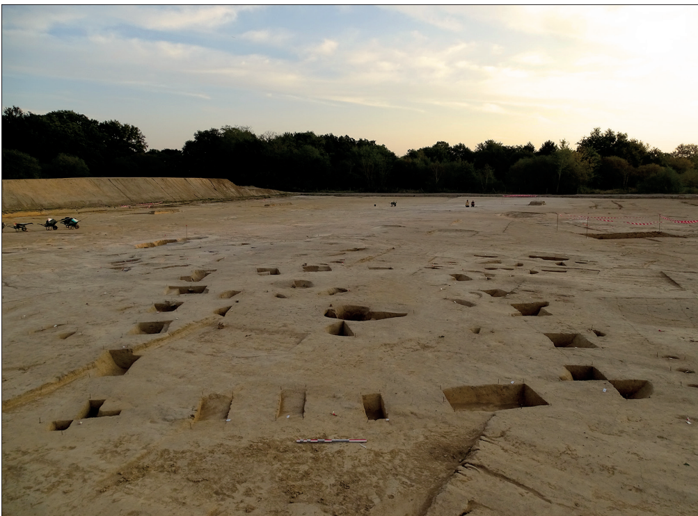
Fig. 4. Vue en cours de fouille de l'établissement rural daté de La Tène finale sur le site de La Louëttrie à Nantes.

On peut dès lors s'interroger sur l'existence de plusieurs pôles, contemporains ou non, au cours des âges des Métaux, structurant ce territoire en lien avec la circulation routière et fluviale, plutôt qu'envisager un site majeur, répondant au modèle traditionnel des lieux centraux, que la recherche archéologique n'a toujours pas identifié. L'observation des cartes archéologiques nous invite ainsi à une lecture multiscalair (à l'intérieur du secteur retenu comme au-delà de la zone de confluence), multipolaire et dynamique de cet espace, en considérant le temps long.