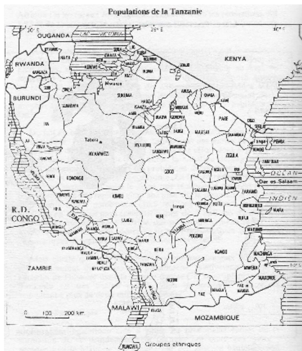
Fig. 1 - Groupes ethniques

Mais quelle que soit l'ampleur des bouleversements actuels, ils n'en demeurent pas moins un phénomène relativement récent à l'échelle de l'histoire dans la longue durée. Car le peuplement de la Tanzanie est très ancien puisque l'on en retrouve des traces remontant à plus de deux millions d'années.