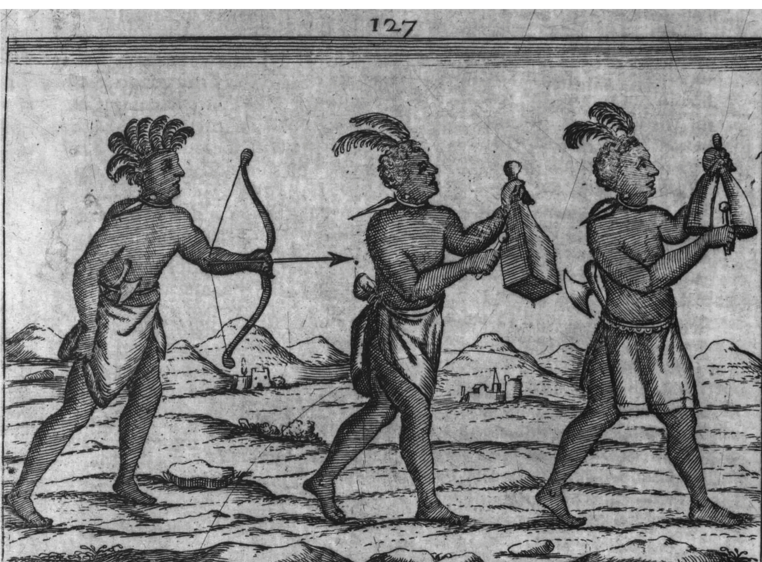
G. A. Cavazzi, Istorica descrizione de tre' regni Congo, Matamba e Angola , version abrégée 1690, p. 127