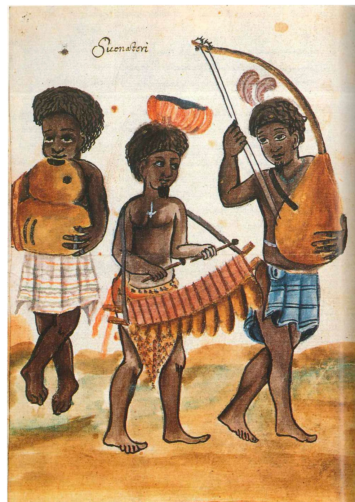
G. A. Cavazzi, E. Bassani, Un cappuccino nell'Africa (Manoscritti Araldi), 1671

Qu'est-ce que les images anciennes d'instruments et de musiciens dans leur contexte permettent de dire des savoir-faire et des pratiques anciennes ? La construction du savoir sur la musique est questionnée avec la prise en compte de la génétique des témoignages écrits et oraux. Certaines sources ont influé sur d'autres des points de vue textuel et visuel, entraînant des recompositions d'images, leur modification et la réinterprétation de leur contenu. Ce phénomène est très présent dans les sources antérieures au XIXe siècle qui a connu un essor des voyages et donc de l'observation de première main. Certaines illustrations des récits les plus anciens ont été utilisées dans des traités musicaux occidentaux des XVIIe et XVIIIe siècles. Ceux-ci font parfois apparaître des contresens organologiques dus à la compréhension erronée des pratiques musicales initialement observées. Pourtant, ces écrits ont longtemps déterminé la compréhension des musiques africaines en Europe.