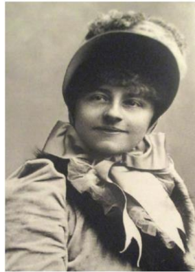
Gyp, comtesse de Martel de Janville (1849-1932).