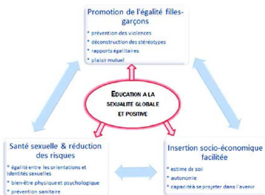
Schéma réalisée par le HCE. Tous droits réservés.

Priorité 4 – Responsabiliser les espaces-clés de socialisation des jeunes hors-école pour prendre en compte leurs parcours de vie.