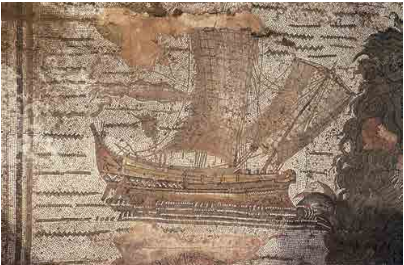
Fig. 6. Détail de la mosaïque du frigidarium des thermes de Thémétra (III e siècle apr. J.-C., Sousse, Tunisie) présentant un bateau ayant des similitudes avec la forme et les proportions du navire de la Madrague de Giens.