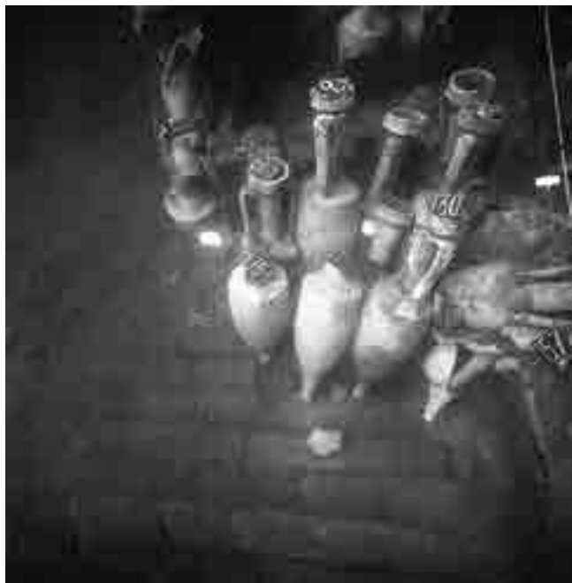
Fig. 3. Dans la zone de la pompe de cale, une pierre esseulée sur le fond de la coque témoigne du passage des urinatores .

de céramiques communes culinaires produites dans la région de Naples. Disposées en caisses au-dessus des amphores, elles étaient également destinées à être vendues à l'arrivée. Quelques pommes de pin pignon avec leurs fruits venaient compléter le chargement du navire.