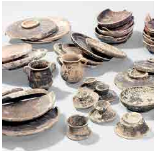
Fig. 2. Lot de céramiques à vernis noir.

Au moment de la déclaration de découverte, l'herbier de posidonies recouvrait presque entièrement le site, ne laissant apparaître que ponctuellement un important amoncellement d'amphores. Cette partie visible de l'épave fut aussitôt la cible d'incessants pillages, ce qui poussa André Tchernia, alors directeur de la Drasm (cf. infra , p. 249), à programmer d'urgence deux interventions, en avril 1967 puis en août 1968. Cette double opération permit, sur la base des prospections magnétiques, d'établir l'importance dimensionnelle du gisement. Contrariés par les aléas matériels et météorologiques, qui entraînèrent notamment le naufrage de la barge qui servait de support de fouille en 1968, les travaux ne purent réellement débuter qu'à l'été 1972. L'épave fit dès lors l'objet de campagnes de fouilles annuelles conduites par une équipe de l'Institut d'Archéologie Méditerranéenne (IAM, Université de Provence-CNRS 1 ), placée sous la direction d'André Tchernia, de Patrice Pomey et d'Antoinette Hesnard. Les travaux s'achevèrent en 1982, après onze campagnes qui firent de ce chantier la plus importante fouille archéologique sous-marine de Méditerranée. Il est vrai que le gisement, long d'une quarantaine de mètres sur une douzaine de mètres de largeur, correspondait à la plus grande épave antique jamais fouillée de façon aussi complète. Les équipes eurent recours de façon systématique à la stéréophotogrammétrie pour