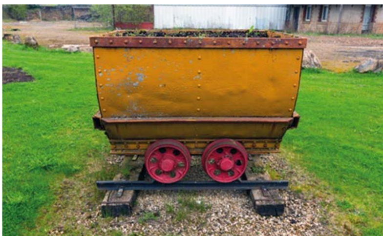
Fig.2 – Berline de mine – bac à fleurs.

Avant d'ouvrir aux pistes de réflexion, nous souhaiterions nous arrêter sur deux productions récentes, de la promotion 2021-2022. L'auditeur Thierry Hotton a retenu une berline-bac à fleurs comme dispositif de médiation STS. Il s'agit originellement d'un wagonnet de mine chargé de transporter le minerai appelé minette, devenue bac à fleurs sur un rondpoint de Moselle. On peut penser ici à la philosophie simondonienne : quel est le mode d'existence de cet artefact ? D'un côté, il y a perversion de la technicité de l'objet, désormais réduit à la seule fonction décorative, et détournant donc son essence technique. D'un autre côté, cet artefact se fait le protecteur d'un passé industriel révolu, le garant d'une mémoire d'un métier et d'un ancien bassin minier. La Moselle minière se matérialise alors dans cet objet d'un autre temps. Le statut de l'objet n'est donc pas immuable. D'abord sans identité, produit de série, la berline standardisée acquiert une identité individuelle, localisée, qui remet en cause son usage normal en faveur d'un usage incongru, mais pour mieux devenir historique.