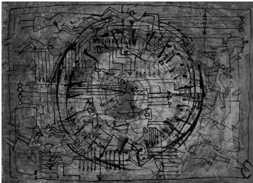
Fig. 2: Béatrice Turquand d'Auzay, L'Horloge numérique – en couleur en couverture. Huile et encre sur papier et traitement numérique, interprétation lors de la diffusion en feuilleton sur Mediapart , 2011; couverture, Hermann, 2012

hors de lui, au moins une part des vœux qui s'étaient attachés au mystérieux nom d' Odds .