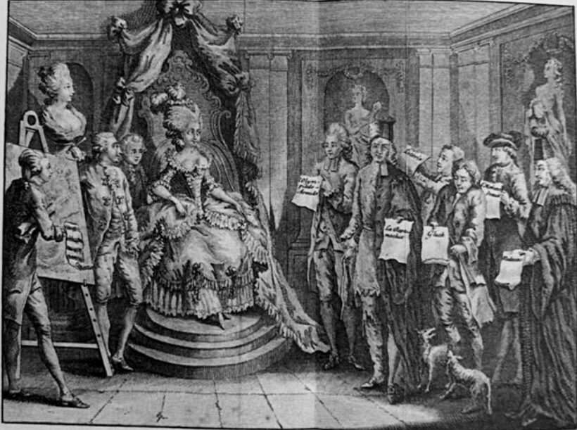
La Séance chez une Amatrice