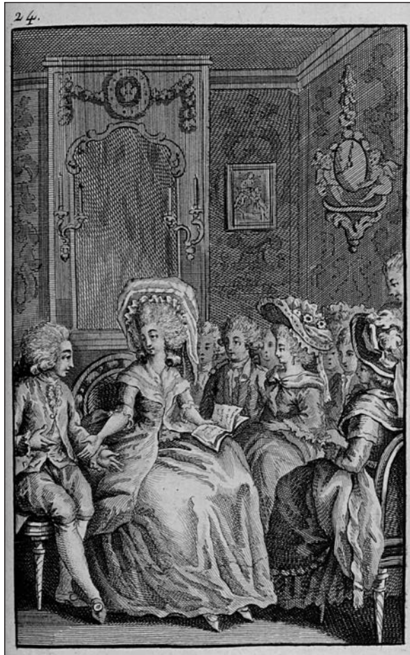
Frontispice de « L'Épouse d'homme d'esprit » dans Les Françaises 20 e juvénale « Les Romains »