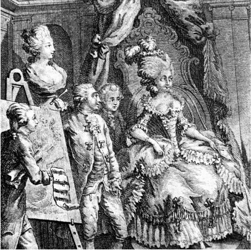
La Séance chez une Amatrice (détail)

« L'Amatrice sur un siège élevé par des gradins, entourée d'auteurs et d'artistes [...]. Derrière l'Amatrice sont un peintre, un sculpteur et un musicien. Tous sont debout, par respect pour la Présidente »