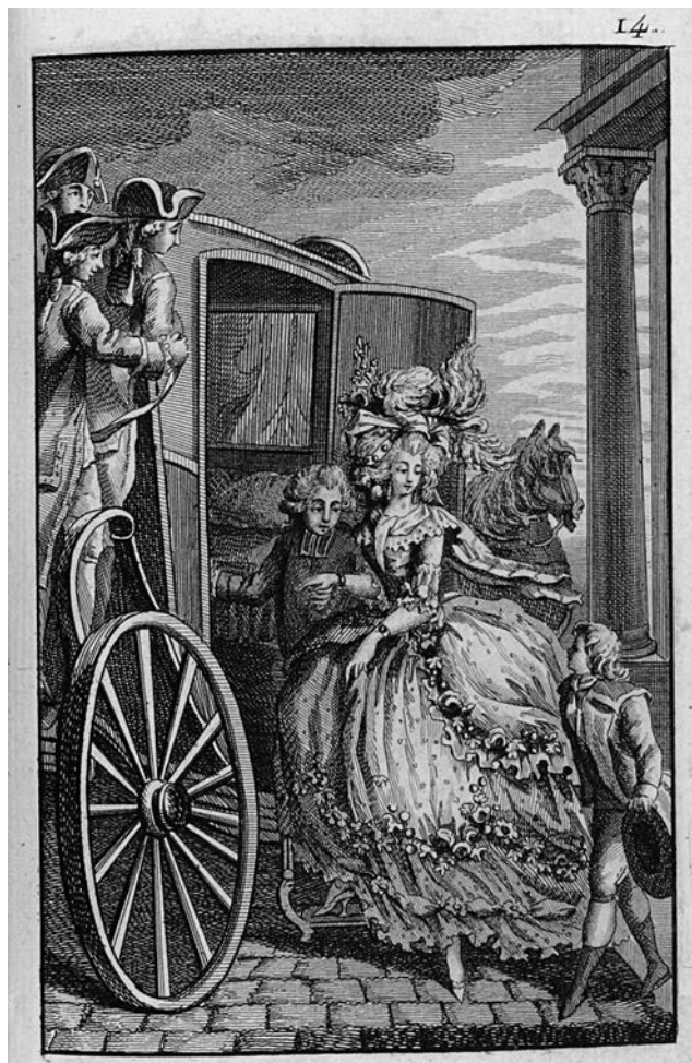
Illustration de « La Femme dépensière » dans Les Françaises 21 e juvénale : « Le Luxe »