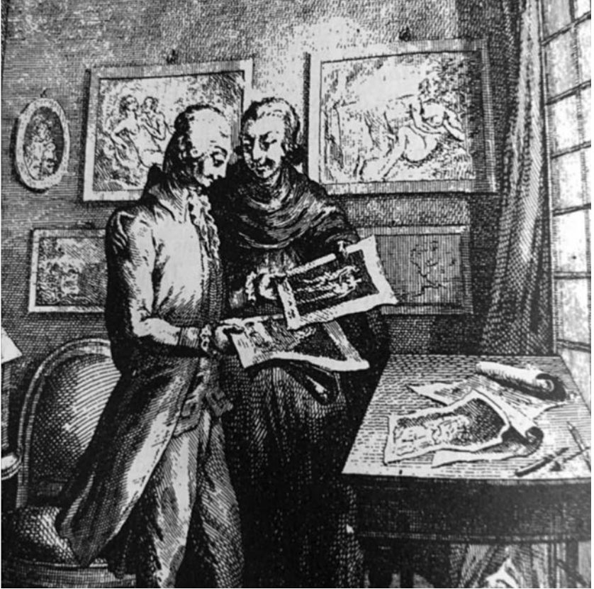
Edmond et Gaudet (Détail)

Rétif de la Bretonne, Le Paysan et la Paysanne pervertis , éd. Pierre Testud, Paris, Honoré Champion, « Champion Classiques », 2016, p. 98