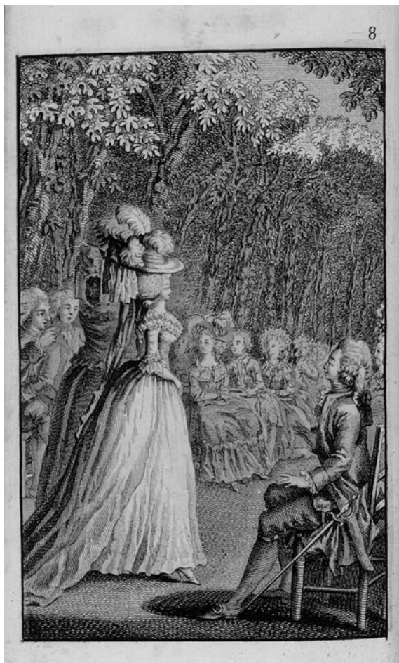
Les Françaises : « La Fille courue » 17 e juvénales – « Les Billets d'avis »