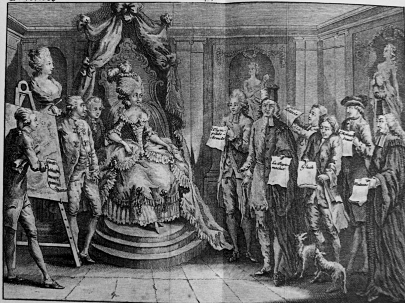
La Séance chez une Amatrice