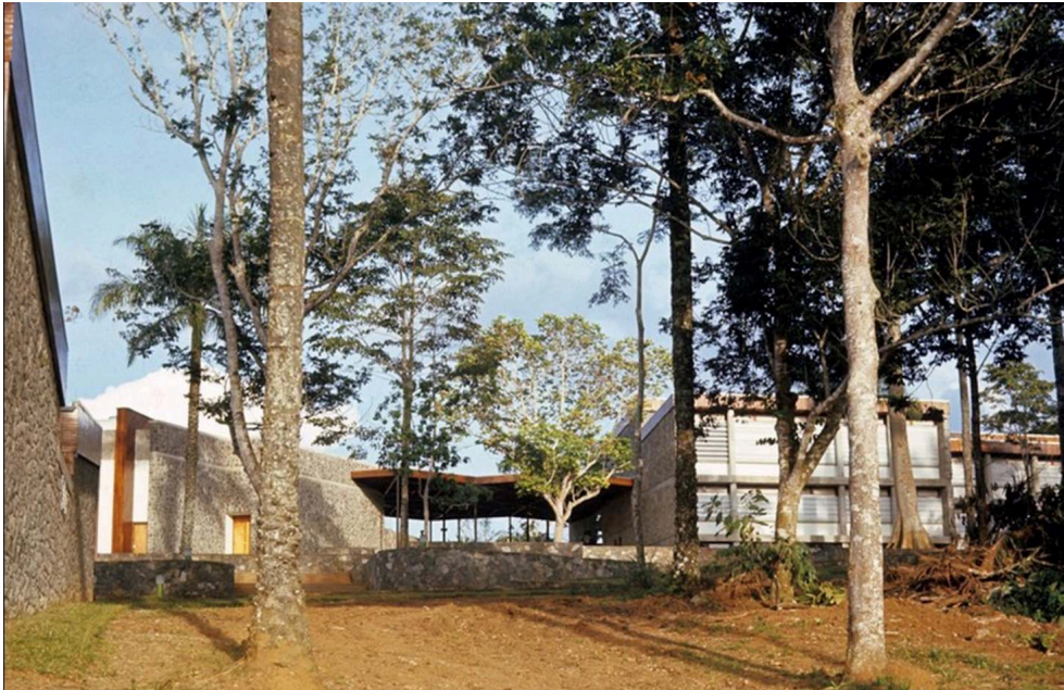
Fonds Écochard, n° 84315, fondation Aga-Khan, n.d.