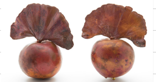
Claude Lalanne (1925-2019), boucles d'oreilles en collaboration avec la maison Dior, collection Haute Couture Printemps-Été 2017 (première collection de Maria Grazia Chiuri)