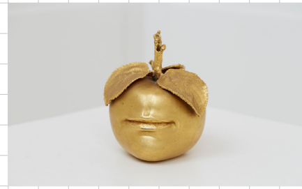
Claude Lalanne (1925-2019), Pomme Bouche, réalisée en 1975 et exécutée en 1980, sculpture en bronze doré, H. : 14 cm