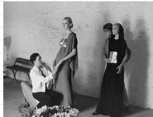
Claude Lalanne (1925-2019), Buste et taille sculptés en collaboration avec Yves Saint-Laurent, collection Haute Couture Automne-Hiver 1969