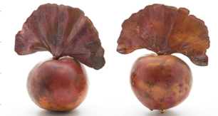
Claude Lalanne (1925-2019), boucles d'oreilles en collaboration avec la maison Dior, collection Haute Couture Printemps-Été 2017 (première collection de Maria Grazia Chiuri)