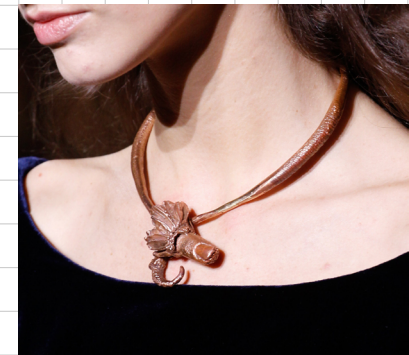
Claude Lalanne (1925-2019), collier en collaboration avec la maison Dior, collection Haute Couture Printemps-Été 2017 (première collection de Maria Grazia Chiuri)