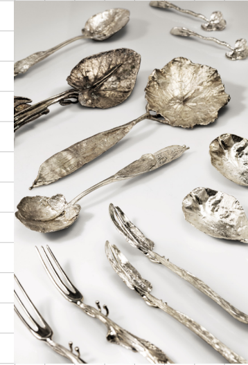
Pour Salvador Dalí Claude Lalanne (1925-2019), Service Sven, service en argent comprenant 22 pièces, 1974