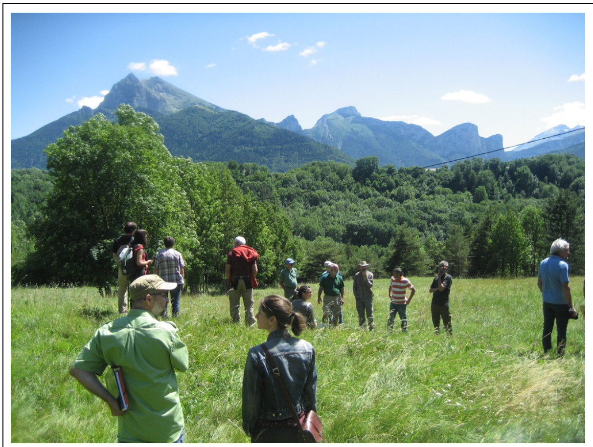
Photo 5 : L'équipe de géologues en visite guidée par des habitants du secteur de Corps