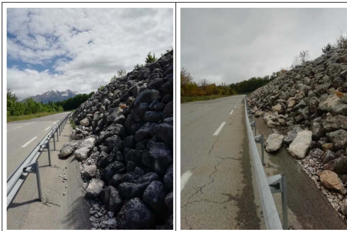
Photos 6 et 7 : Le confortement de Charlaix en juin 2021 et novembre 2022

Mais avec le recul, on s'est dit qu'on avait raté le coche, qu'on aurait dû être plus présent au lancement du projet. Notamment parce qu'il y a des enjeux humains associés derrière. Du coup, ça fait sens de mettre tout le monde autour de la table. Parce que de toute façon, tout le monde est impacté et tout le monde a son rôle à jouer. Donc au final, oui, je trouve que c'est une très bonne chose de mettre tout le monde autour de la table. Je dirais même que c'est comme ça qu'il faut qu'on arrive à travailler à l'avenir. Ce n'est pas forcément évident, on n'y arrivera peut-être pas tout le temps, mais dans l'absolu, c'est comme ça qu'on doit travailler si on veut être efficace. »