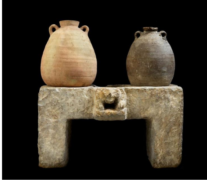
Fig. 4. Amphores LRA 5/6 de Tôd (Louvre, inv. E 27230). Online : https://collections.louvre.fr/en/ark:/53355/cl010048369

Une grande partie des amphores produites en Égypte tiraient leur couleur rouge ou brune tant du type de pâte utilisée que de leur cuisson. Les amphores LRA 7 et LRA 5/6 de type 4 étaient façonnées dans l'argile alluvial qui abondait dans la vallée du Nil. Une cuisson insuffisante produisait un rouge brique, une cuisson moyenne un rouge-brun et une surcuisson un brun-noir 227 . Les amphores LRA 7 sont majoritairement brunes ; les LRA 5/6 présentent une couleur extérieure rouge dans le Delta et brune ou marron lorsqu'elles proviennent de Moyenne-Égypte 228 . La cuisson des argiles calcaires provenant notamment de Maréotide donnait aux amphores une couleur blanchâtre, pour les moins cuites, à chamois ou brun pour une cuisson normale, voire verdâtre à mauve en cas de surcuisson 229 .