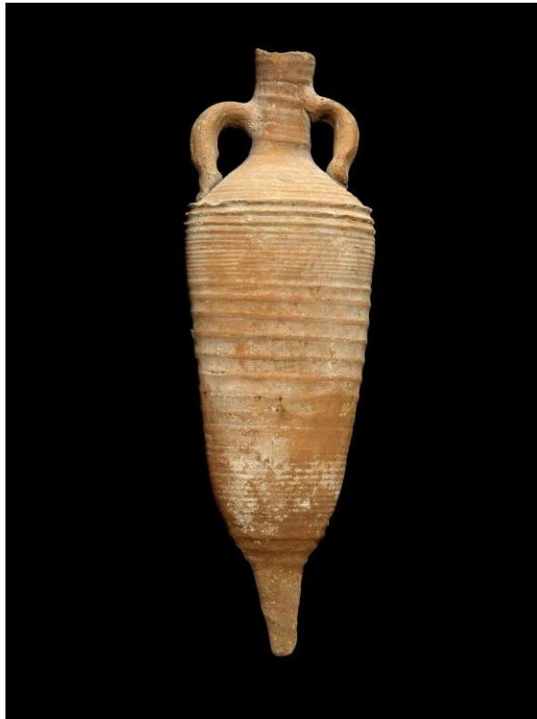
Fig. 2. Amphore LRA 7 de Baouit (Louvre, inv. E 12127). Online : https://collections.louvre.fr/en/ark:/53355/cl010041910