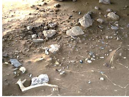
Fig. 7– Vue d'ensemble. Niveau IV20, unité 18-E74.

À l'extérieur des tentes, la répartition au sol des déchets de toutes sortes permet de retrouver la nature des activités s'étant déroulées dans le campement (fig. 7). Le dépeçage du gibier et le travail des peaux s'effectuaient dans les espaces entre les tentes. Les foyers extérieurs étaient soit en bordure de la tente, soit dans des aires plus périphériques du campement. Dans ce dernier cas, ils ne servaient pas à la cuisine et étaient réservés à des activités techniques réalisées en plein air. D'autres foyers semblent avoir été destinés à des activités particulières – feux de courte durée allumés lors d'une seule activité ; foyers ne contenant plus que de la cendre, peut-être seulement affectés à la production d'un peu de chaleur et de lumière, foyers aux contours peu nets, dont les braises ont été regroupées et dispersées successivement, pour une opération qui requérait un feu couvert.