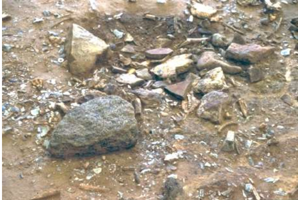
Fig. 6– Le foyer et le poste de travail. Niveau IV20, unité 27-M89.

En revanche, des espaces vides de vestiges en forme de croissant occupant le fond des tentes circulaires évoquent des aires de repos qui devaient être aménagées avec des peaux de renne. D'autres zones relativement dégagées, situées dans des aires de travail entourées de cordons de vestiges, pourraient correspondre à des tapis de sol en peau. La présence d'habitations doubles ou triples suggère l'existence d'une structure sociale complexe, plutôt qu'une juxtaposition d'unités familiales.