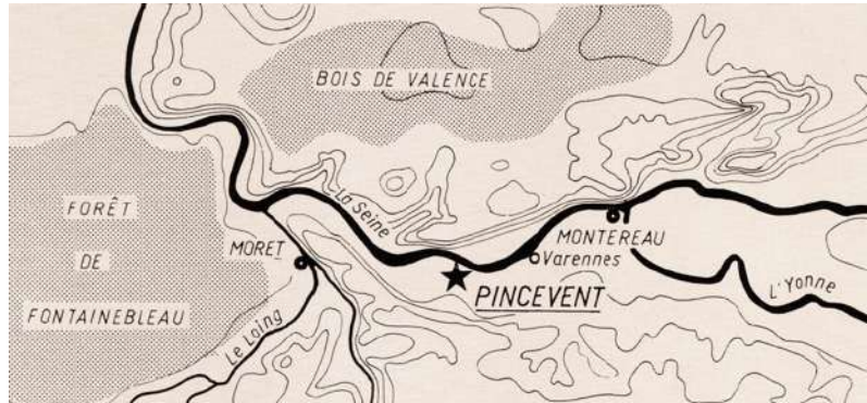
Fig. 2– Situation de Pincevent, au sud du confluent de la Seine et de l'Yonne (Leroi-Gourhan, 1984, p. 6)

Ces reconstitutions ne sont permises que grâce à la méthode de fouille conçue par Leroi-Gourhan, sous l'influence des archéologues russes des années 1930, qui consiste à décapier les couches archéologiques en suivant leur stratigraphie naturelle, c'est-à-dire les variations de niveau et de pente des sols enfouis. On ôte la couche de sédiments fins qui nappe les vestiges en suivant la surface du sol