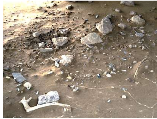
Fig. 7 – Vue d'ensemble. Niveau IV20, unité 18-E74.

À l'extérieur des tentes, la répartition au sol des déchets de toutes sortes permet de retrouver la nature des activités s'étant déroulées dans le campement (fig. 7). Le dépeçage du gibier et le travail des peaux s'effectuaient dans les espaces entre les tentes. Les foyers extérieurs étaient soit en bordure de la tente, soit dans des aires plus périphériques du campement. Dans ce dernier cas, ils ne servaient pas à la cuisine et étaient réservés à des activités techniques réalisées en plein air. D'autres foyers semblent avoir été destinés à des activités particulières – feux de courte durée allumés lors d'une seule activité ; foyers ne contenant plus que de la cendre, peut-être seulement affectés à la production d'un peu de chaleur et de lumière, foyers aux contours peu nets, dont les braises ont été regroupées et dispersées successivement, pour une opération qui requérait un feu couvert.