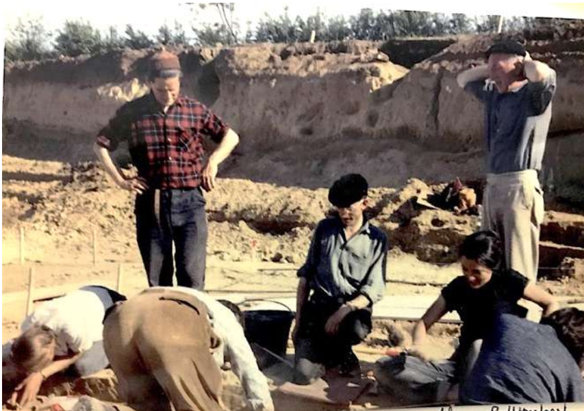
Fig. 1– André Leroi-Gourhan, debout en chemise écossaise. Premiers jours de la fouille de l'habitation n° 1. Mai 1964.

Il a assuré la direction des fouilles de Pincevent jusqu'en 1985, en y étant présent tous les étés. Ceux qui l'ont connu se souviennent de son passage entre les préfabriqués le matin pour réveiller les fouilleurs au son du biniou, et aussi de ses promenades matinales à cheval sur le terrain jouxtant le chantier de fouille. Après son décès, les membres de son équipe ont formé à leur tour une nouvelle génération de préhistoriens qui poursuivent aujourd'hui les fouilles. Ainsi, depuis plus de 50 ans, des chercheurs encadrent des fouilleurs bénévoles, qui suivent scrupuleusement les méthodes de fouilles préconisées par « le Patron ».