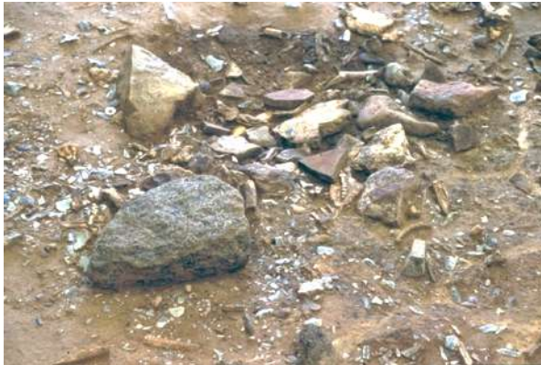
Fig. 6 – Le foyer et le poste de travail. Niveau IV20, unité 27-M89.

En revanche, des espaces vides de vestiges en forme de croissant occupant le fond des tentes circulaires évoquent des aires de repos qui devaient être aménagées avec des peaux de renne. D'autres zones relativement dégagées, situées dans des aires de travail entourées de cordons de vestiges, pourraient correspondre à des tapis de sol en peau. La présence d'habitations doubles ou triples suggère l'existence d'une structure sociale complexe, plutôt qu'une juxtaposition d'unités familiales.