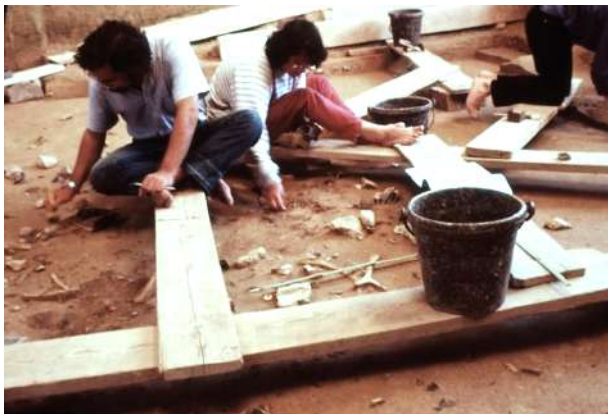
Fig. 3– Décapage horizontal en cours. Vers 1966

Les vestiges préhistoriques ont été trouvés sur les rives d'anciens bras de la Seine. L'endroit a offert durant des siècles un passage à gué entre les confluents de la Seine et de l'Yonne en amont et ceux de la Seine et du Loing en aval (fig. 2). La configuration de la vallée, bordée de falaises crayeuses, suggère que le gué a existé depuis des millénaires, favorisant ainsi le passage des hommes et des animaux.