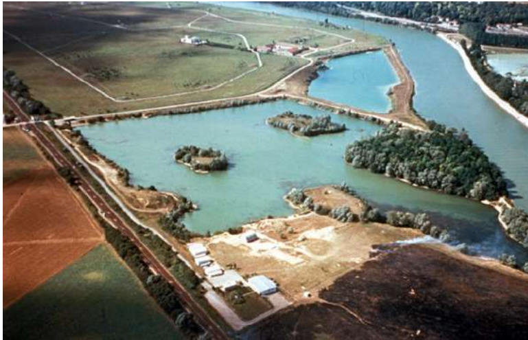
Fig. 4– Vue aérienne du site de Pincevent. Entre 1970 et 1975

archéologique de la base d'une pièce à la base d'une autre (fig. 3). Puis l'emplacement exact de chaque vestige est relevé dans les trois dimensions à l'aide d'une lunette ou d'un théodolite et ces mesures reportées sur des plans. Ces relevés, accompagnés de nombreuses photographies et photogrammétriques, sont facilités aujourd'hui par l'usage de théodolites laser couplés à des ordinateurs. Ensuite les vestiges eux-mêmes sont sortis de terre, lavés et marqués, l'intégralité des informations concernant leur provenance est