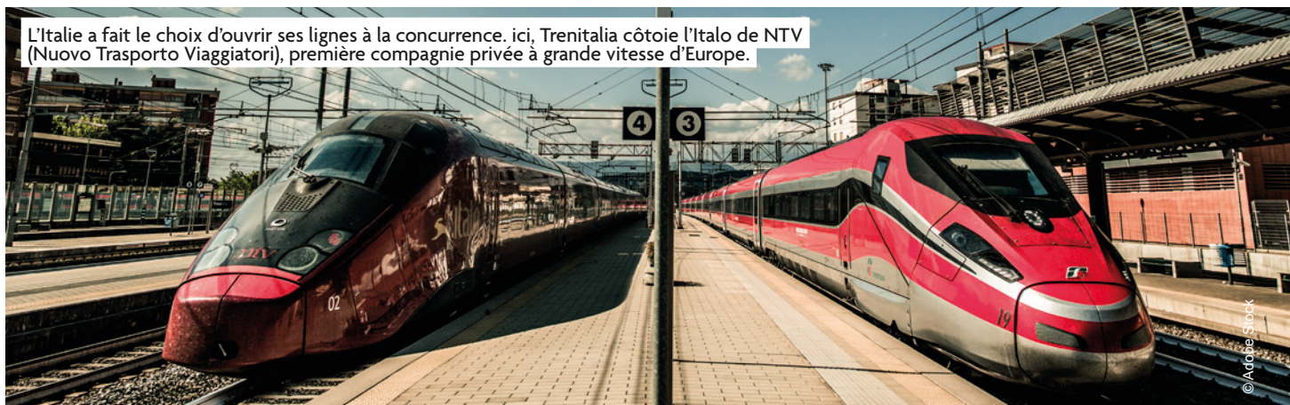
L'Italie a fait le choix d'ouvrir ses lignes à la concurrence. ici, Trenitalia côtoie l'Italo de NTV (Nuovo Trasporto Viaggiatori), première compagnie privée à grande vitesse d'Europe.

les trains italiens, seulement 10 % de plus qu'à la fin du xx e siècle. Le TGV (21 milliards de voyageurs-kilomètres) s'est donc substitué aux services ferroviaires classiques et à une partie du trafic aérien domestique, mais dans un contexte de déclin démographique et économique qui limite la demande potentielle. Depuis le début du siècle, la dénatalité et l'émigration font diminuer la population de l'Italie et le revenu par habitant y était en 2019 à peu près le même qu'en 2007.