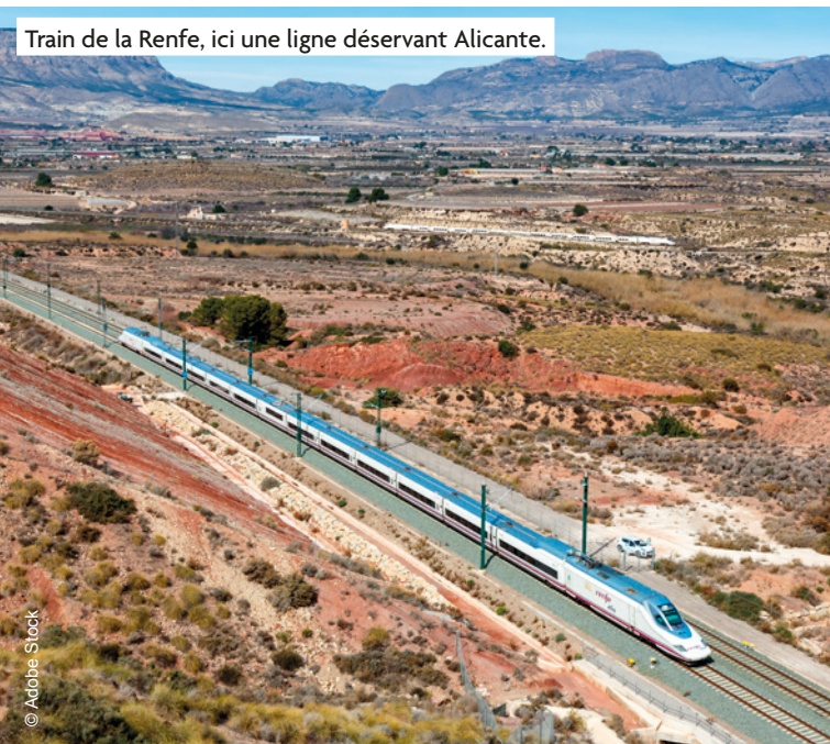
Train de la Renfe, ici une ligne déservant Alicante.

En Espagne, le réseau classique n'avait pas été construit en utilisant l'écartement UIC 5 (Union internationale des chemins de fer). La connexion avec le réseau européen supposait une adaptation coûteuse à laquelle l'Espagne, avec l'aide généreuse de l'Union européenne, a préféré substituer la création ex nihilo d'un réseau LGV. Il apparaît surdimensionné si l'on oublie de prendre en compte quelques facteurs-clefs venus s'ajouter au caractère obsolète du réseau classique.