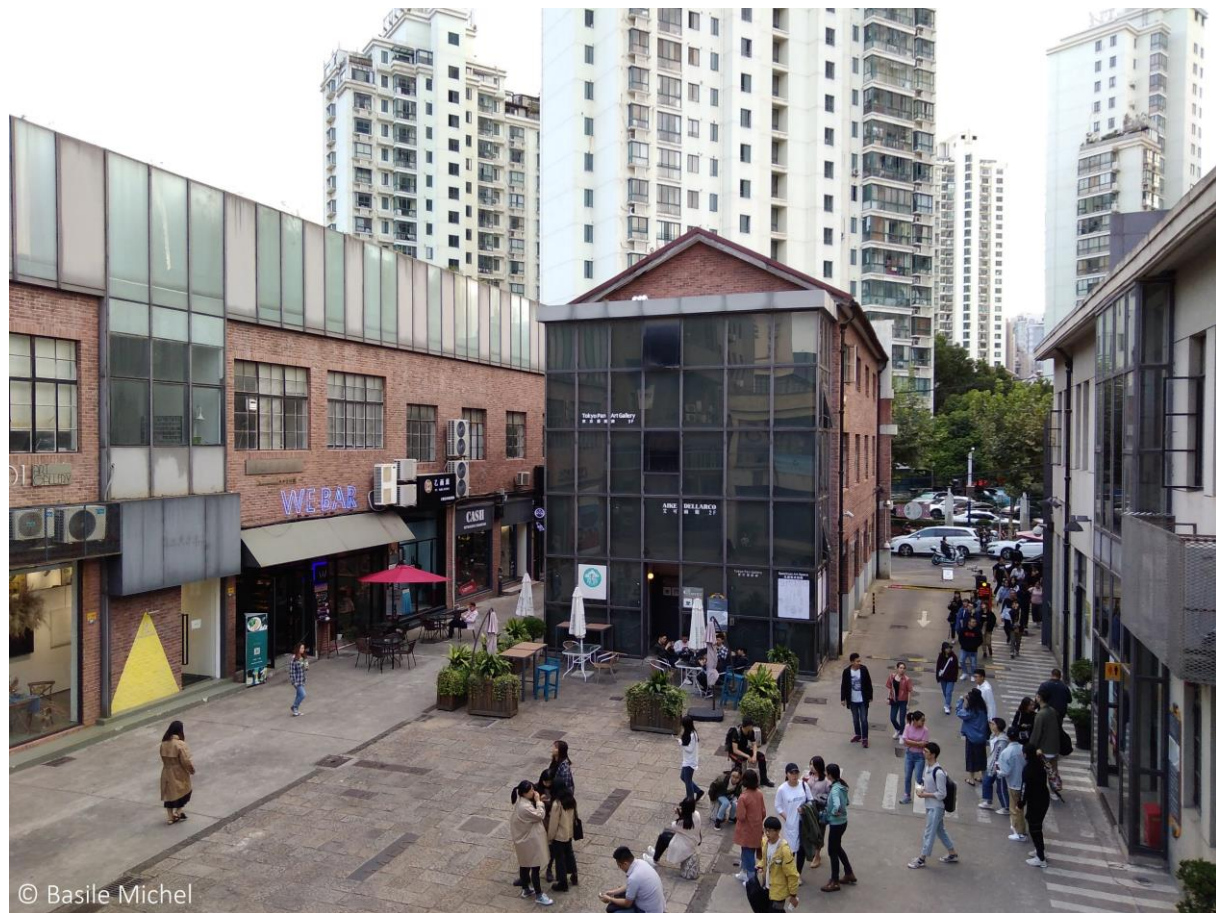
Photo 2 : Le M50, un quartier artistique et touristique à Shanghai