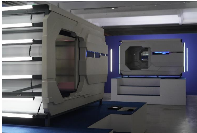
© « Captive », Romain Tardy

L'examen du rapport des publics aux arts numériques a mis en évidence des résultats intéressants, notamment en ce qui concerne les œuvres immersives . Ces nouveaux dispositifs en vogue, qu'il s'agisse de réalité augmentée, de réalité virtuelle ou encore d'installations spécifiques tels que « Captive », caissons de sommeil invitant à s'y installer, permettent aux publics de vivre des expériences originales.