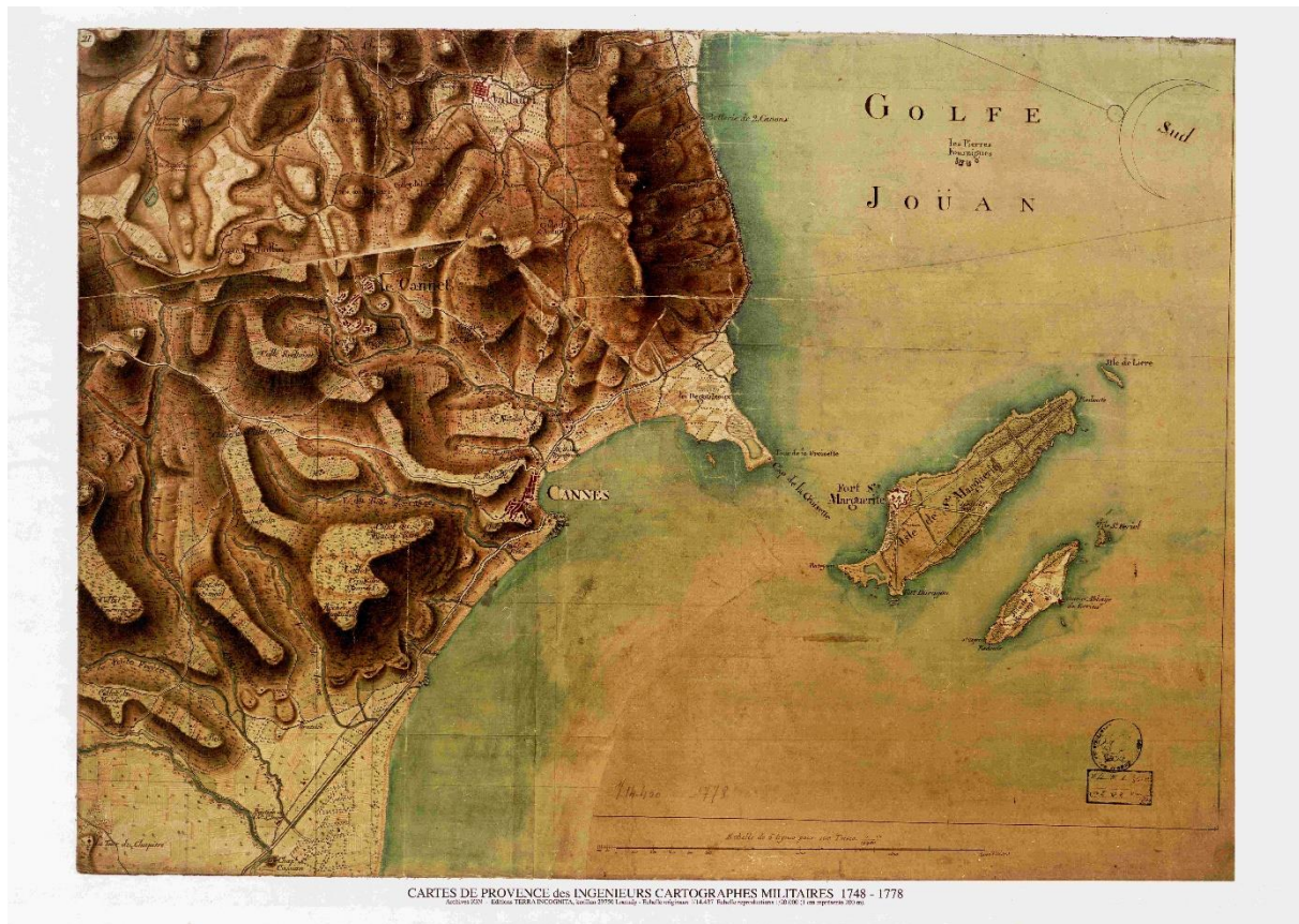
Fig. 1 – Les îles de Lérins

appelé « l'îlot ». Située à environ 800 mètres des côtes cannoises, l'île Sainte-Marguerite est la plus grande de l'archipel (fig.1).