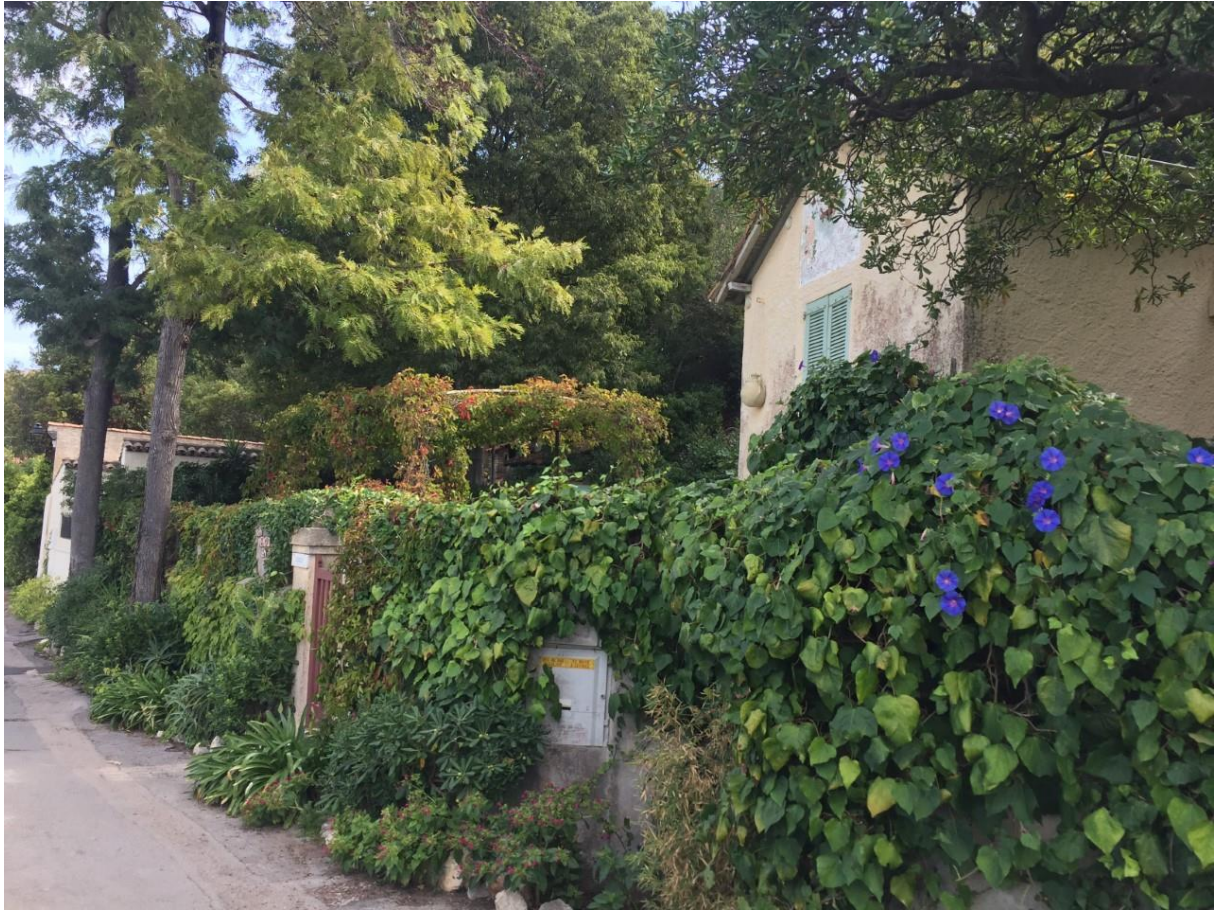
Fig. 2 - Cabanon Lou Lin Goun - Baou (Sainte-Marguerite, août 2022)

du débarcadère, afin qu'ils puissent y construire des cabanons et qu'ils ne soient pas obligés de rentrer à Cannes tous les soirs. Construits sur le rivage nord, ces anciens cabanons forment ce qui est communément appelé « le village ». Certains pêcheurs y possèdent encore un pied-à-terre (fig.2).