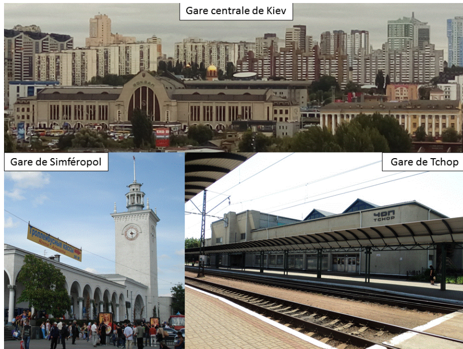
Photo.1 – Gares principales du trafic international de voyageurs d'Ukraine

la région de Kiev (qui ne comprend pas la ville) dans le trafic ferroviaire de voyageurs du pays a augmenté de 12,5 à 21,6% et celle de la ville de Kiev de 28,4 à 32,1% 23 .