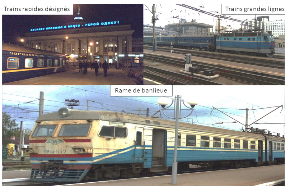
Photo. 2 – Les types de trains de voyageurs en circulation internationale en Ukraine (Clichés I.Savchuk, 2010 et 2015)

Le trafic ferroviaire international de voyageurs de l'Ukraine est en général effectué par des rames formées par Ukrzaliznytsia (Tab.2). Avant les bouleversements de 2014, circulaient des trains de formation mixte de Ukrzaliznytsya et des RJD . Le plus connu était le train rapide Express des capitales («Столичний експрес») reliant Kiev à Moscou, qui a été un leader de la vitesse parmi les trains internationaux de voyageurs d'Ukraine 34 . Sa vitesse commerciale moyenne était proche de celle des express transeuropéens de 1967 : 96,7 km/h (Tab.3) 35 . De 2005 à 2014, il parcourait la distance entre les capitales de la Russie et de l'Ukraine en 9,3 heures (Tab.3), au lieu de 12,3 heures par les trains rapides traditionnels. Ce gain de temps était obtenu principalement par la suppression des arrêts intermédiaires. Le train peut atteindre la vitesse de 150 km/h uniquement sur quelques tronçons de l'itinéraire. Cela est dû à l'état de l'infrastructure ferroviaire, conçue pour un trafic traditionnel mixte de fret et de voyageurs.