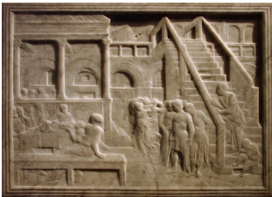
Donatello, Salomé ou le festin d'Hérode (vers 1435)

Le Festin d'Hérode de Donatello (vers 1435) s'organise pareillement selon un point de fuite légèrement décalé à gauche.