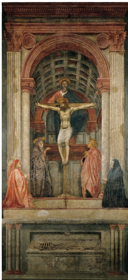
Masaccio, La Trinité (vers 1426)

Le Festin d'Hérode de Donatello (vers 1435) s'organise pareillement selon un point de fuite légèrement décalé à gauche.