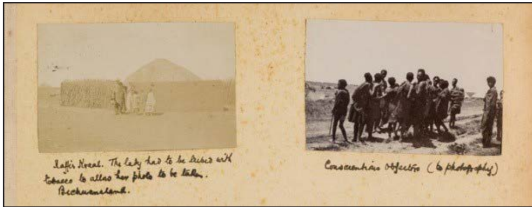
Figure 4. Anonyme, « Kaffir Kraal. The Lady Had to be Bribed with Tobacco to Allow her Photo to be Taken. Bechuanaland » et « Conscientious objectors (to photography) »

Album of photographs of the 14th Brigade (Lincoln Regiment) Field Hospital in the Boer War (1899-1901*) , p. 17. https://wellcomecollection.org/works/j4hs98ha/items?canvas=16 [archive]. Londres : Wellcome Collection, numéro d'inventaire : RAMC/1612. En ligne : https://wellcomecollection.org/works/j4hs98ha . CC BY-NC 4.0