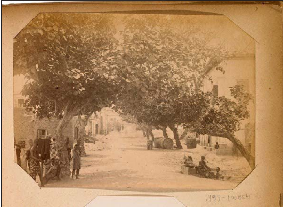
Figure 2.-Anonyme, « Ashanti Rd. C.C. »

Tirage argentique inséré dans un album, 13,5 x 19,5 cm, env. 1910. In Ghana Photographs (1889-1910*).